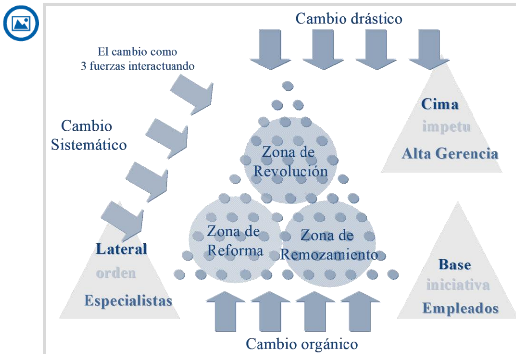
Figura 2. El triángulo del cambio

Fuente: Quy Nguyen Huy y Henry Mintzberg, 2003.