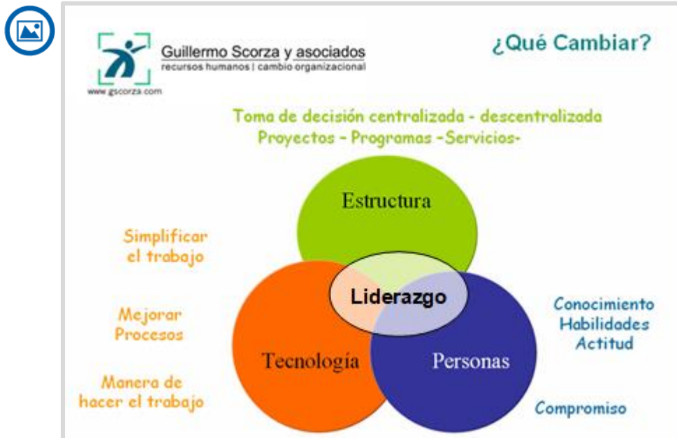
Figura 4. ¿Qué puede cambiar un gerente?