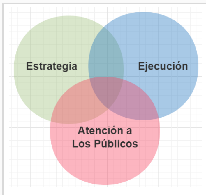
Figura 4: Diagrama de Venn: Los factores clave del social media training

Como mencionamos anteriormente, el rol de las redes sociales es el de acelerar los mensajes acortando las distancias entre quien origina el contenido y el público final; pero, también, en social media , encontramos a los medios tradicionales de comunicación con sus cuentas, que son, a su vez, de gran alcance. Es por ello que todo lo que realicemos en este ámbito deber tener consideraciones prácticas de cómo lograr buenos resultados y efectividad en tres factores fundamentales.