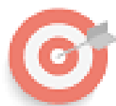
Figura 2. Misión, visión y valores