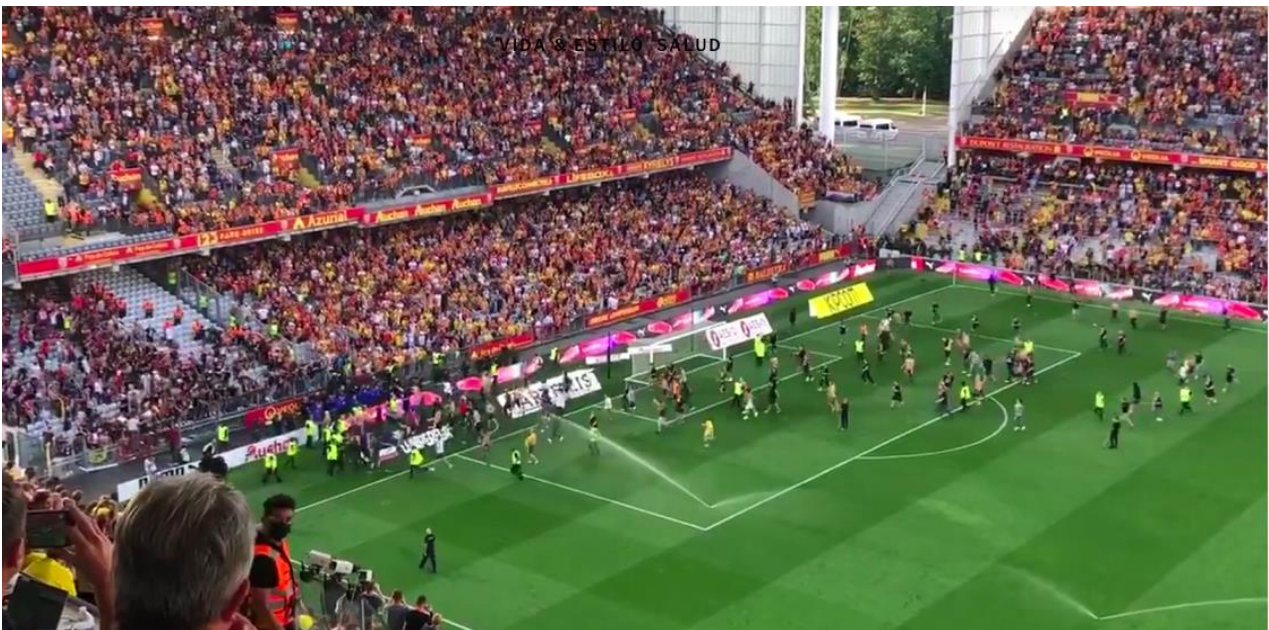
Figura 2: Invasión de cancha por aficionados