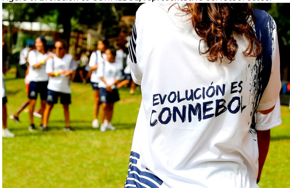
Figura 6: Evolución es CONMEBOL, representativa del fútbol actual

Transformar, evolucionar, integrar e implementar tecnología en cada uno de los clubes del continente concierne a la generación de proyectos que respondan a las necesidades de cada asociación en el contexto de cada país. Proyectos que apoyen las licencias de clubes y entrenadores, proyectos de torneos de fútbol femenino, mejoramiento de la infraestructura de los campos de juego, la implementación del VAR (árbitro asistente de video), las capacitaciones en las distintas modalidades del fútbol, la organización de más competencias y una buena gobernanza permiten elevar la calidad del fútbol sudamericano.