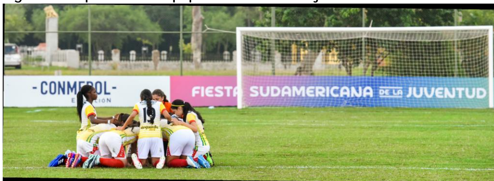
Figura 5: La pasión del equipo femenino festejando ordenadamente

Atendiendo a los desafíos y exigencias de la sociedad sudamericana del siglo XXI, se pone un especial énfasis en que los entrenadores, profesores e instructores que trabajan con el fútbol de base y [los clubes] juveniles tengan en cuenta que un atleta del mundo fútbol 2.0, en Sudamérica, debe hacer evidente su valor como persona, en su juego y en su vínculo con la sociedad, porque no es posible eludir el hecho de que, antes o después del partido, el jugador siempre está expuesto a ser abordado por la prensa, [que], conjuntamente con las redes sociales... viraliza sus opiniones sobre el fútbol y sobre un amplio abanico de temas sobre los cuales se le puede pedir “su parecer” (CONMEBOL, 2019, p. 25).