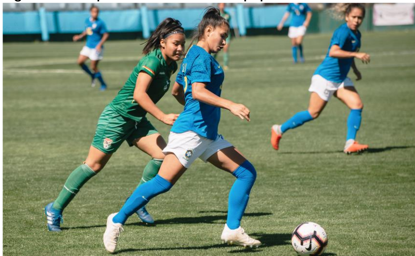
Figura 4: Competencia entre dos equipos femeninos