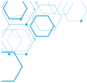
Figura 2: Filmadora e Tripé