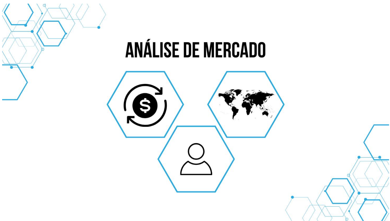
Figura 5: Análise de mercado

O mercado de futebol é um ecossistema complexo e dinâmico. Desde a análise das tendências globais até a avaliação precisa do valor de mercado de um jogador individual, a capacidade de navegar nesse espaço com conhecimento e discernimento pode ser a diferença entre o sucesso e o fracasso de um clube, tanto dentro quanto fora de campo.