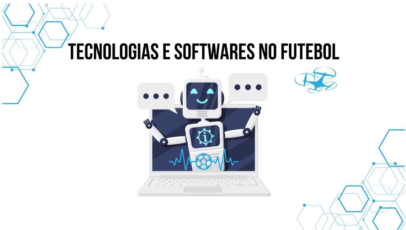
Figura 1: Tecnologias e Softwares no Futebol

Imagine só a quantidade de informações que são geradas em treinos, jogos da própria equipe e dos adversários. Se usarmos o guia no módulo anterior, temos informações coletivas, grupais, setoriais, individuais e das diversas posições de jogo. Para conseguir organizar e analisar tudo isso, a tecnologia tem sido uma grande aliada.