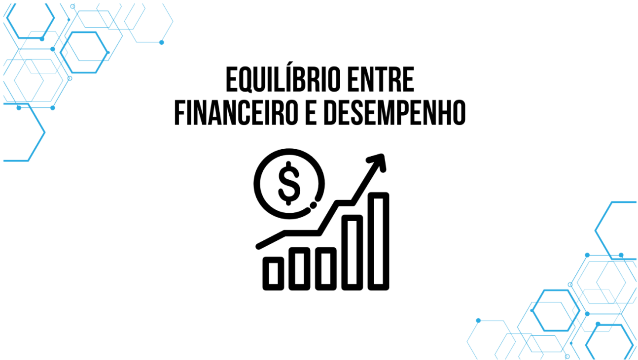
Figura 6: Equilíbrio entre financeiro e desempenho