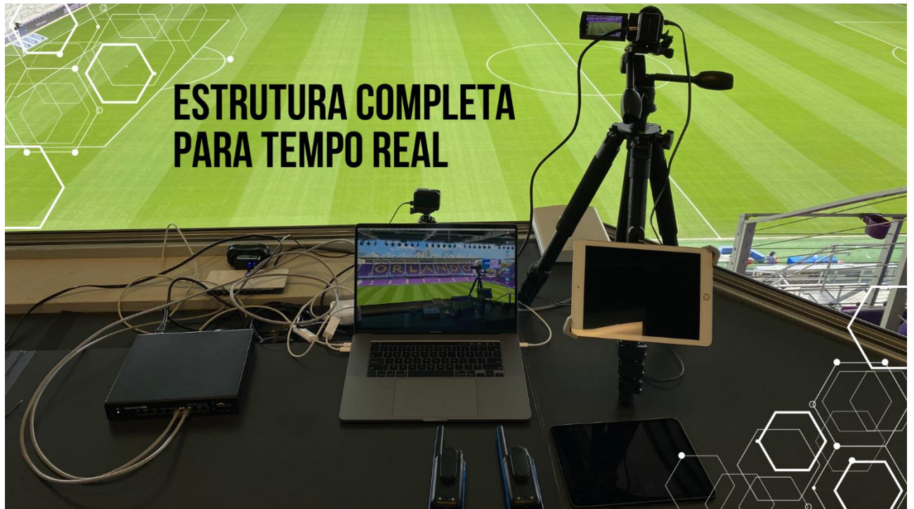
Figura 3: Estructura completa para tempo real