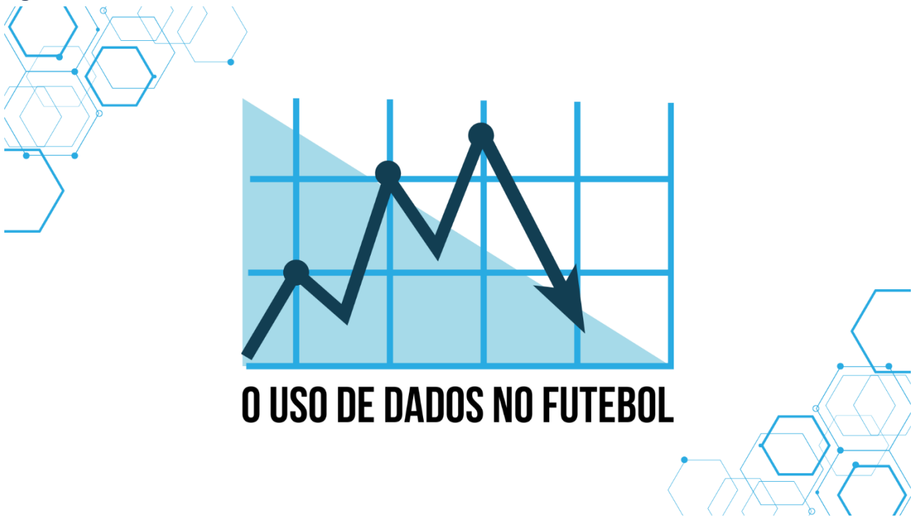
Figura 4: O uso de dados no futebol