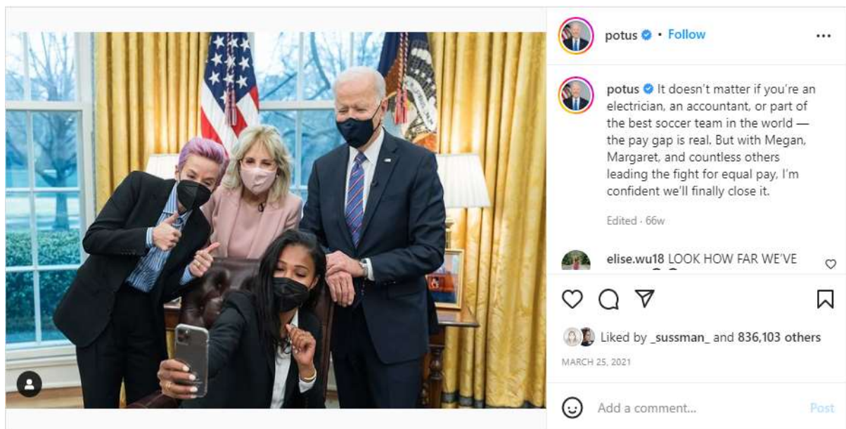
Figura 10: Mensaje de Joe Biden