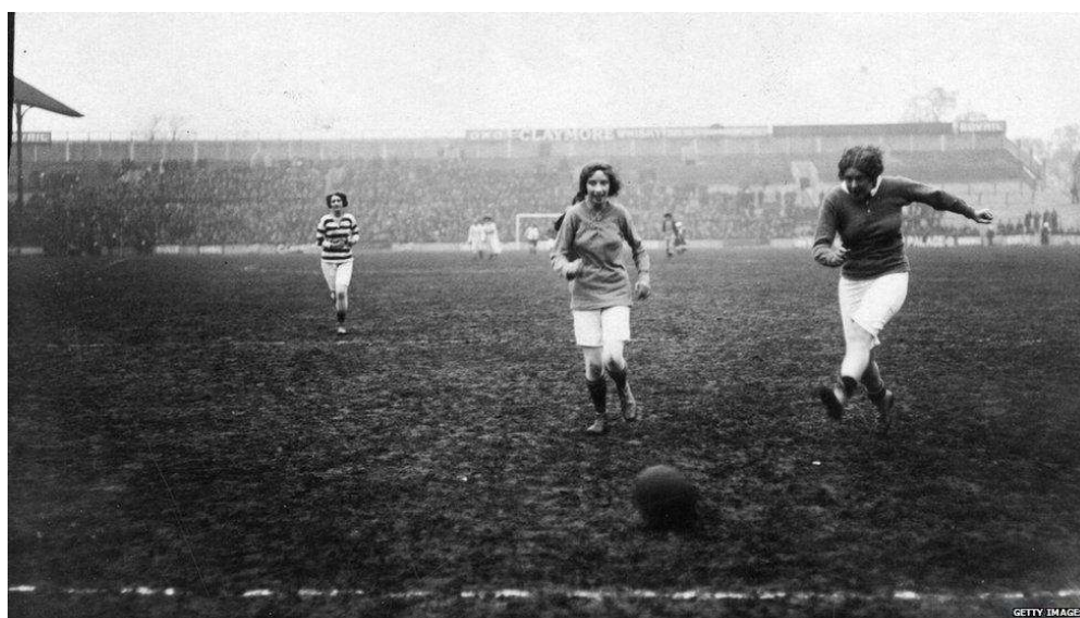
Figura 5: Gran multitud de espectadores en un partido de fútbol femenino celebrado en Tottenham, al norte de Londres, en 1912.