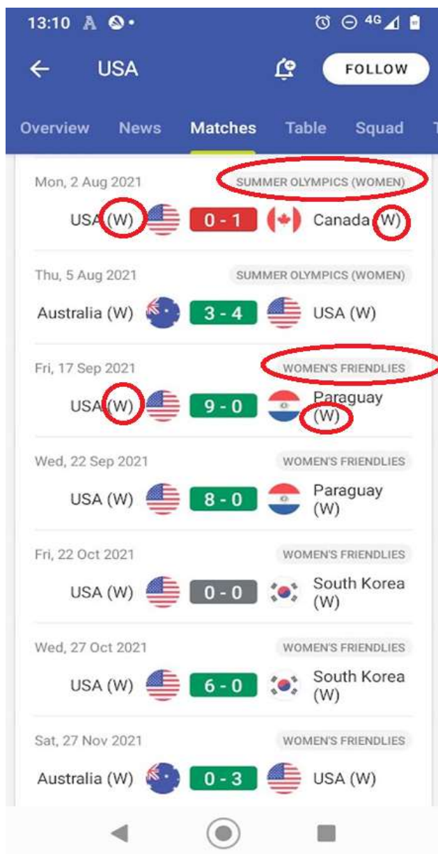
Figura 2: Aplicación de fútbol conocida (FotMob)