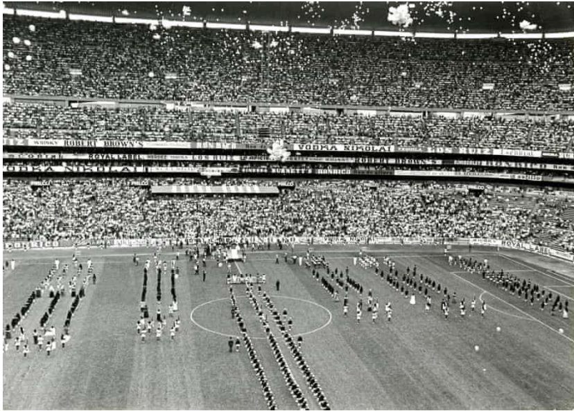
Figura 6: Ceremonia de inauguración de la Copa del Mundo Femenina en 1971