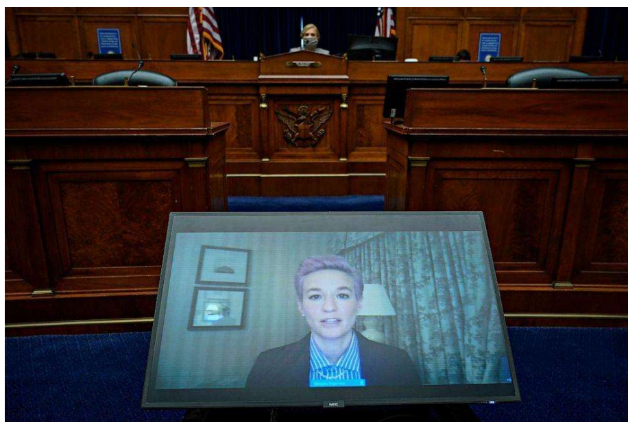
Figura 9: Megan Rapinoe, jugadora de la selección femenina de EE.UU. y defensora de la igualdad salarial