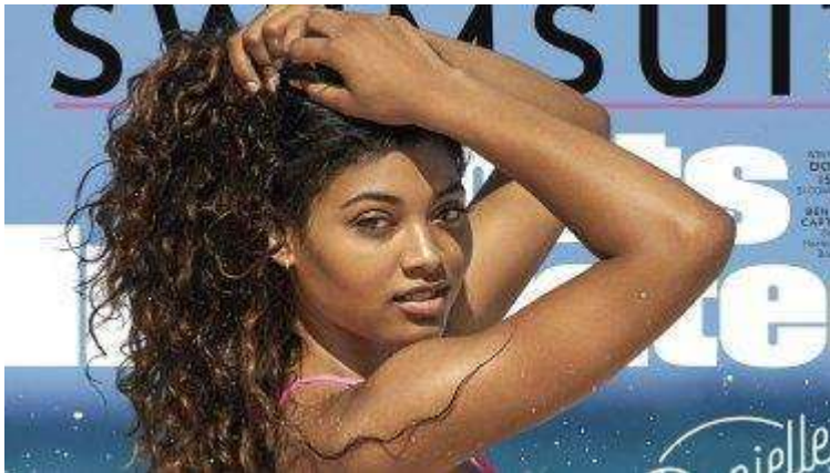
Figura 8: Portada de Sports Illustrated