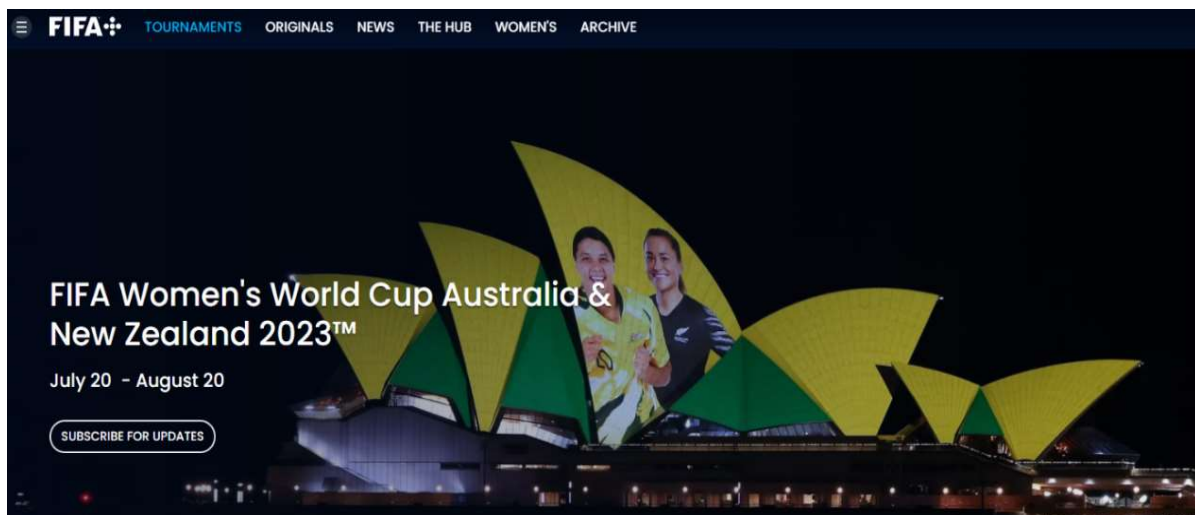
Figura 4: Sitio oficial de la Copa Mundial Femenina de la FIFA de Australia y Nueva Zelanda 2023