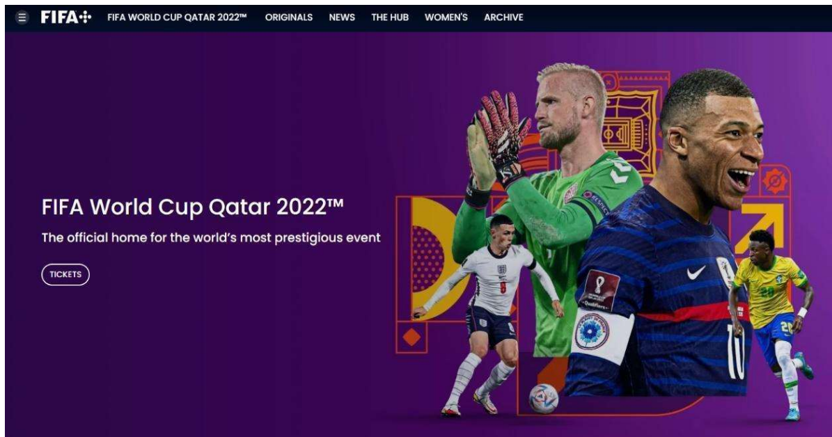
Figura 3: Página oficial de la FIFA