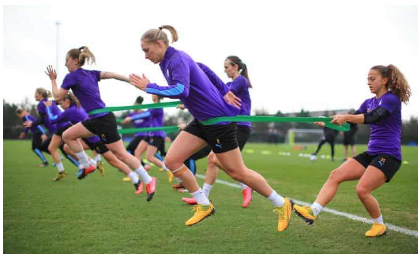
Figura 13: Los equipos femeninos del Manchester City se fotografían entrenando