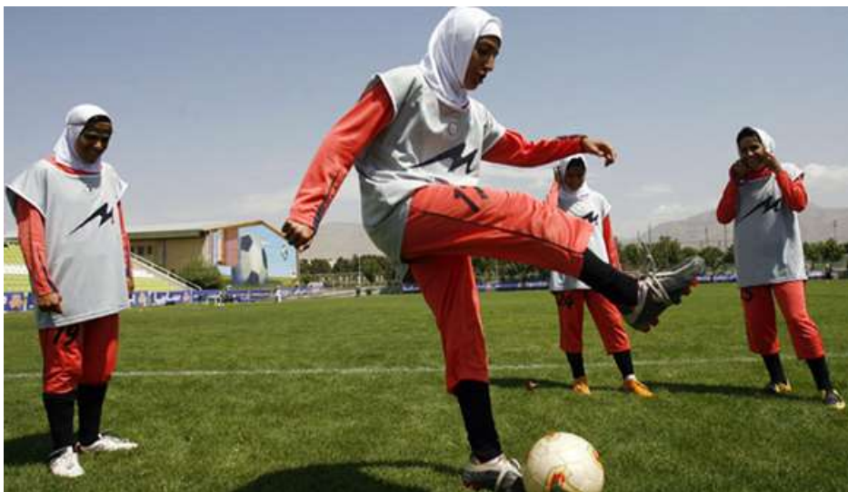
Figura 7: Jugadoras de la selección nacional femenina de Irán entrenan con el hiyab puesto.