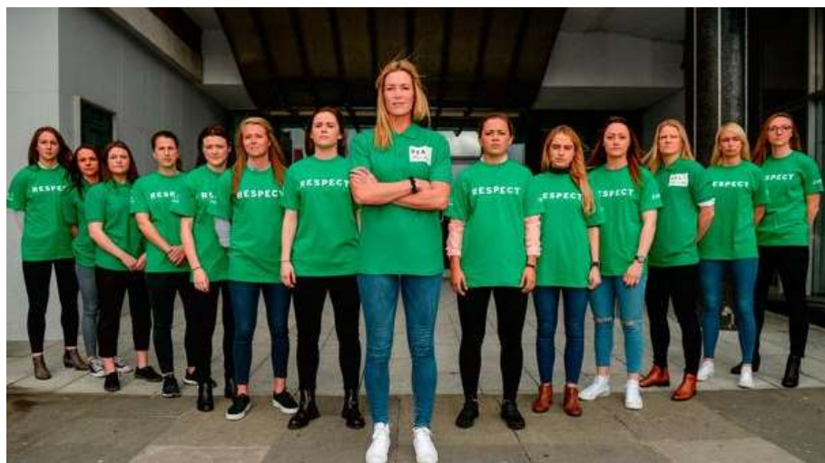
Figura 14: Jugadoras de la selección femenina de la República de Irlanda