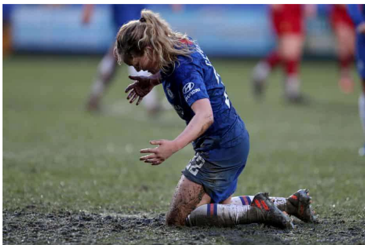
Figura 12: Erin Cuthbert

En la imagen 12, se puede ver a Erin Cuthbert, del Chelsea FC, jugando en un terreno de juego muy embarrado en Prenton Park, el campo del Liverpool Women. La calidad de este terreno es notablemente inferior a la de Anfield, donde juega el equipo masculino del Liverpool.