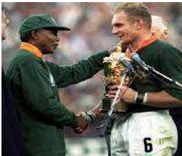
Figura 4: Nelson Mandela y Francois Pienaar celebran la victoria de Sudáfrica en la Copa del Mundo