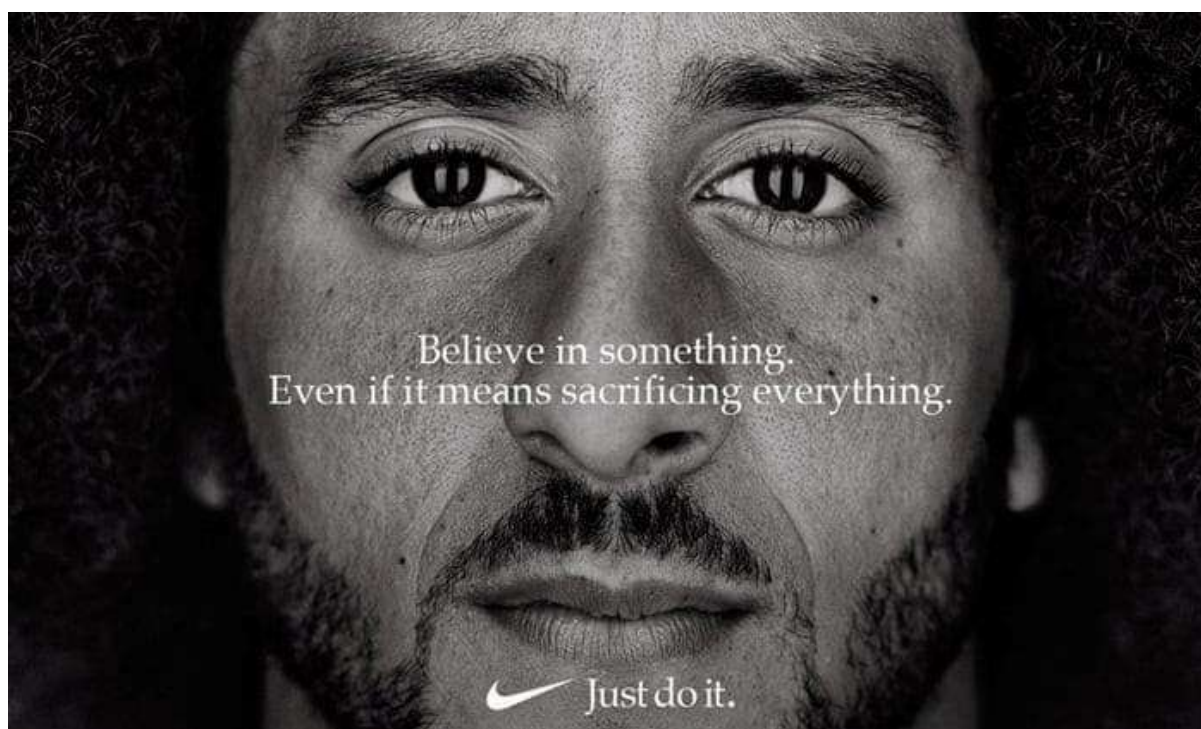
Figura 3: Imagen de la campaña publicitaria 'Dream Crazy' de Nike