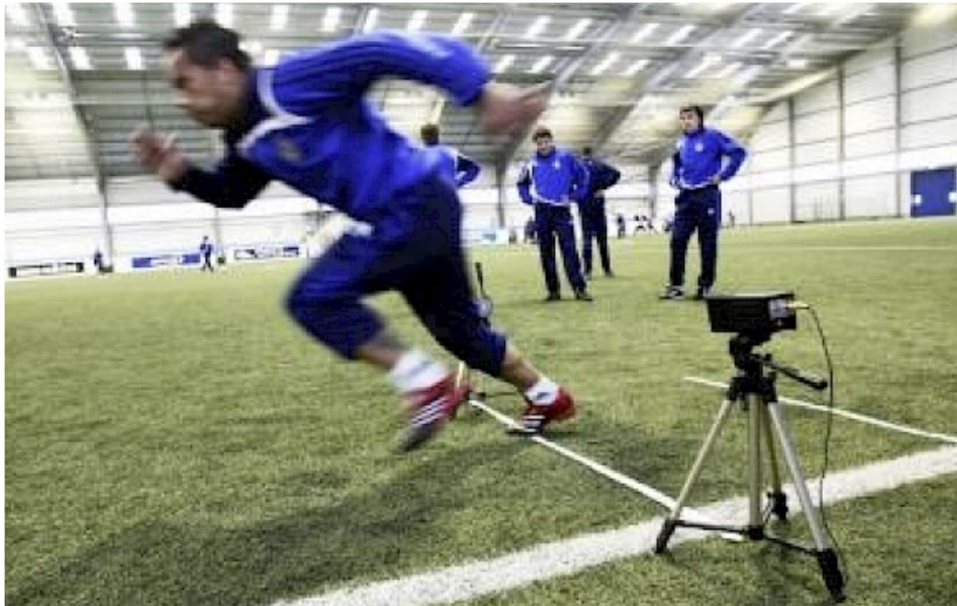
Figura 2: Continuidad de la velocidad en jugadores de fútbol