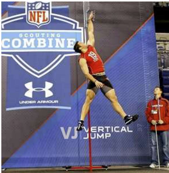
Figura 3: Normas y puntuaciones promedio del salto vertical