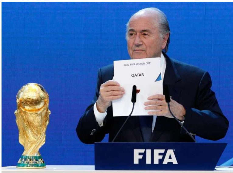
Figura 4: El Presidente de la FIFA, Joseph Blatter, abre el sobre anunciando la sede de la Copa Mundial de la FIFA 2022