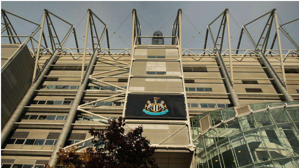
Figura 5: Estadio del Club de Fútbol Newcastle United