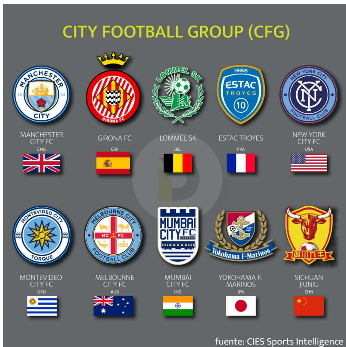
Figura 6: El grupo City Football

El City Football Group es propietario de clubes en Estados Unidos, Australia, India, Japón, España, Uruguay, China, Bélgica, Francia y de su club insignia, el Manchester. El grupo es propiedad de Abu Dhabi United Group (78%), la empresa estadounidense Silver Lake (10%), y empresas chinas: China Media Capital y CITIC Capital (12%).