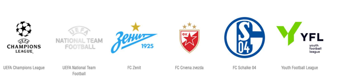
Figura 2: Ejemplos de países y marcas en el Poder Blando