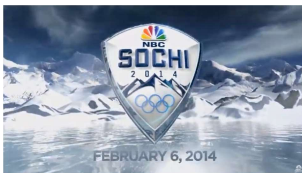
Figura 3: Juegos Olímpicos de Invierno de Sochi 2014

En los años previos al acontecimiento, las emisoras asociadas al COI en todo el mundo proyectaron películas para promocionar los juegos y Rusia.