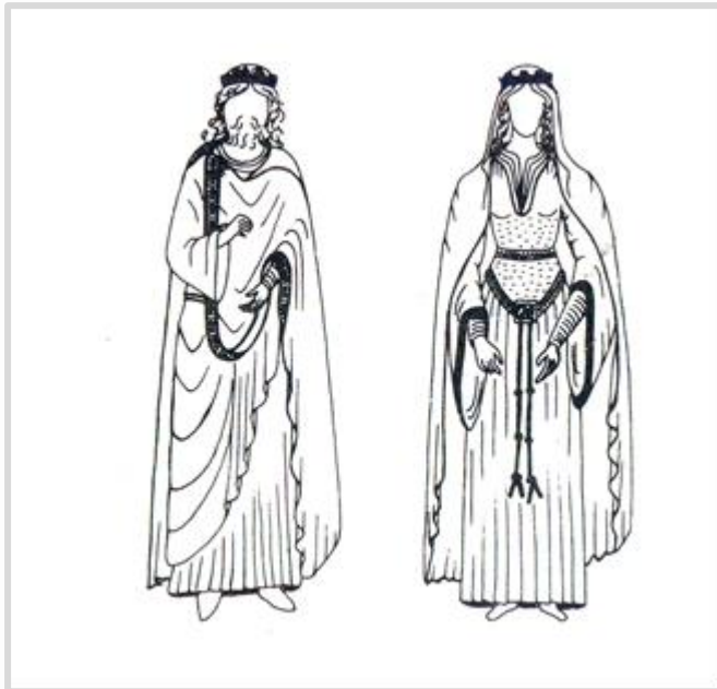
Figura 6: Representación de la mujer hacia 1145-1150

Un primer esbozo de los cambios en la figura femenina se puede observar en la siguiente representación de la mujer en las estatuas-columnas de Chartres, hacia 1145-1150. La cintura y el busto empiezan a ser dotadas de forma por medio de ajustes vestimentarios: