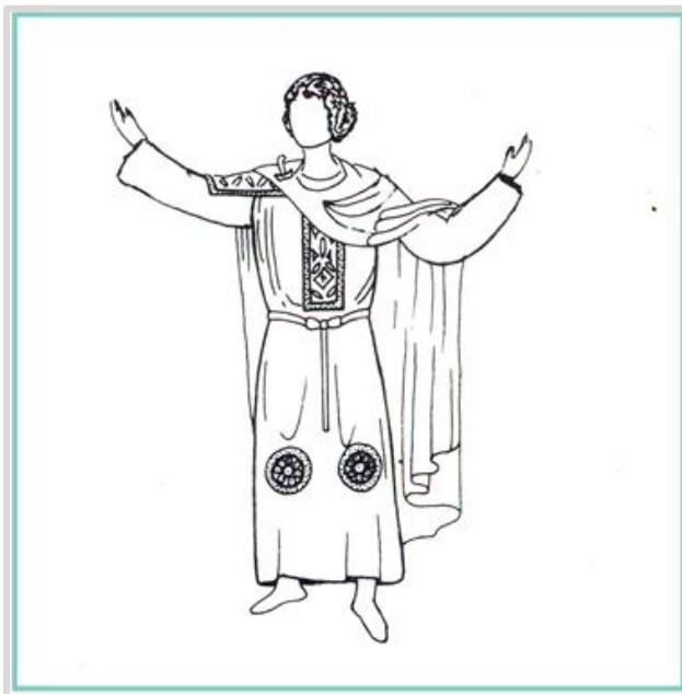
Figura 1: Túnica de mangas, antecedente de la camisa moderna. Dibujo que representa los ejemplares encontrados en tumbas coptas en el siglo I

En Oriente Medio, en las civilizaciones que crecieron y se desarrollaron entre los ríos Tigris y Éufrates, los trajes drapeados aparecen adornados con grandes y muy trabajadas joyas. En la región de Caldea, en la baja Mesopotamia, aparece un tipo de traje que con el tiempo va a prevalecer como uno de los grandes inventos de la indumentaria: la túnica de mangas, tejida de una sola pieza en forma de cruz, dejando en el medio una abertura para que pase la cabeza. Esta túnica es plegada y cosida en los laterales. En cierta manera, puede considerarse como el origen de la camisa actual. A lo largo del tiempo, se adaptaron a diversos usos y maneras de presentarlas: largas o cortas, adornadas o lisas, de lino o de seda, sueltas o ajustadas. Algunos historiadores sostienen que es probablemente el tipo de vestimenta que usó Cristo, ya que estaba en la zona de influencia que abarcó el uso de este hábito vestimentario.