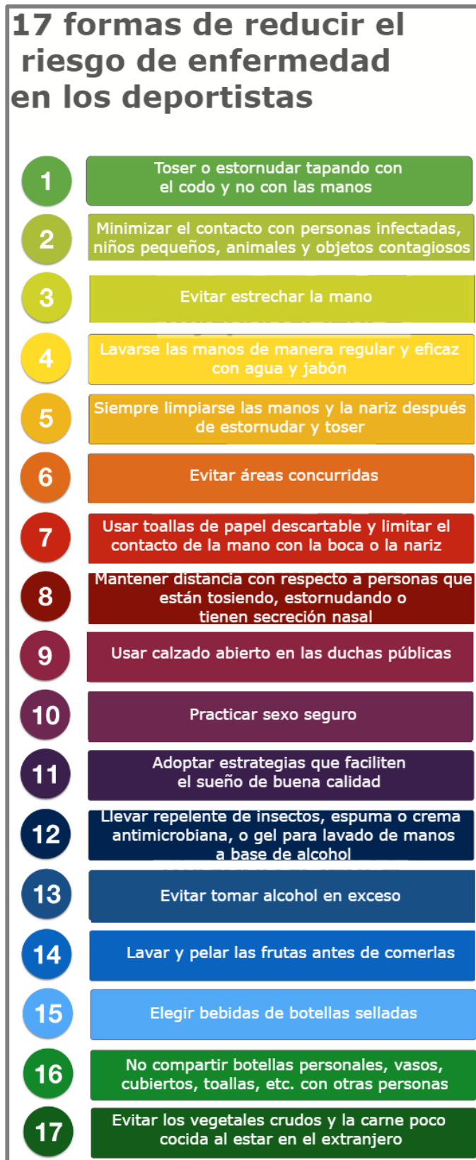
Figura 2: 17 formas de reducir el riesgo de enfermedad en los deportistas