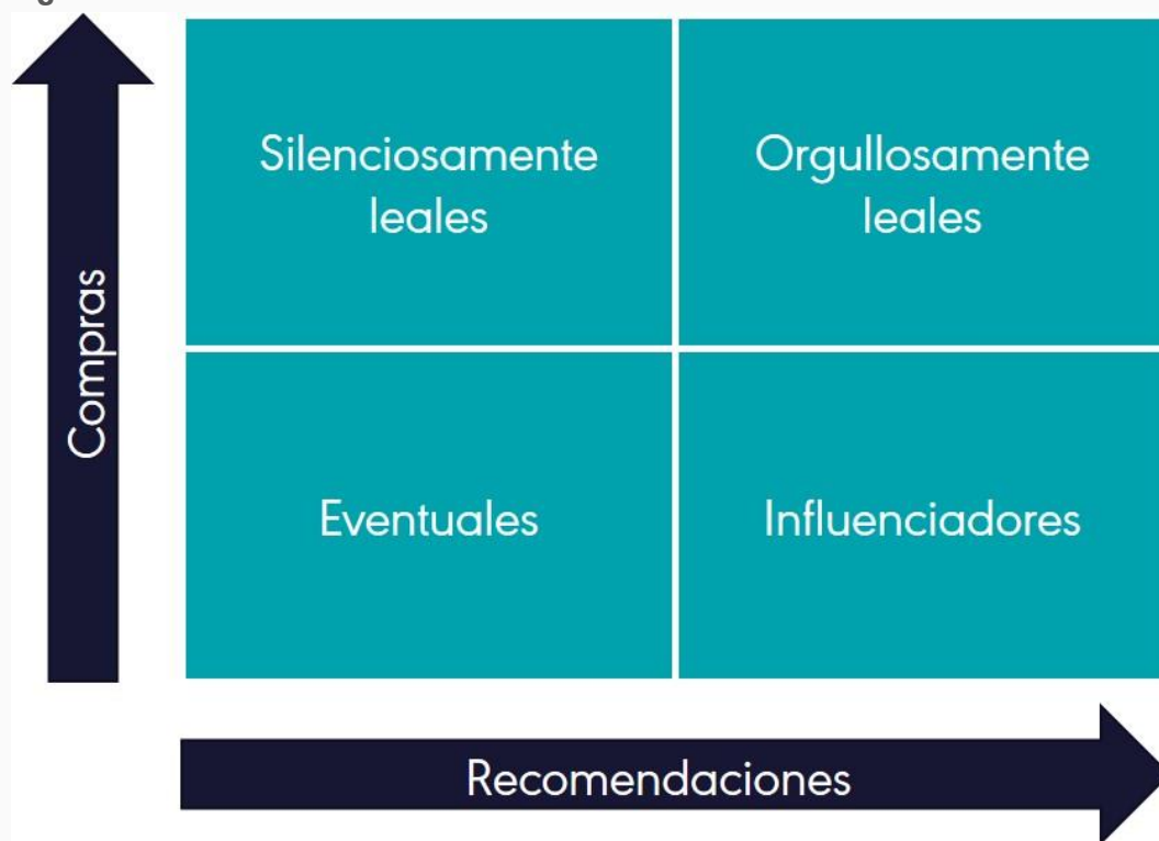
Figura 1: Matriz de lealtad