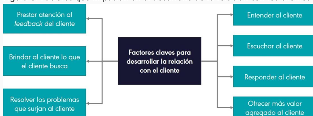
Figura 3: Factores que impactan en el desarrollo de la relación con los clientes

Al continuar nuestro análisis, podemos entender que, si buscamos impactar de manera positiva en el lifetime value del cliente, debemos conocer acabadamente cuáles son los factores que impactan en el desarrollo de la relación con los clientes, pues de dicha relación dependerá que vuelvan a comprarnos y que nos recomienden.