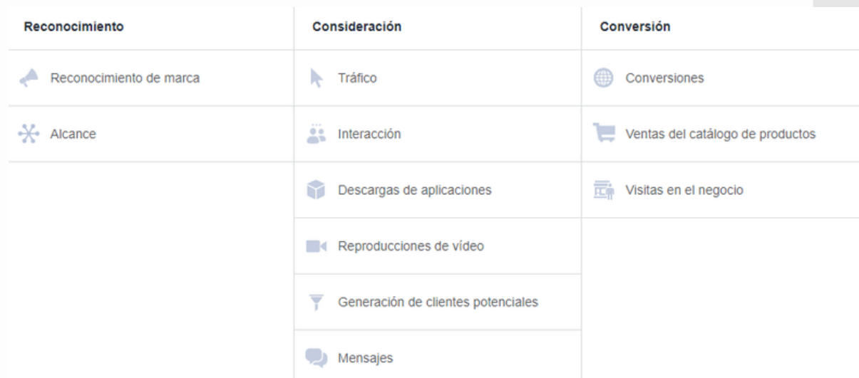
Figura 6: Configuración de una campaña publicitaria en Facebook