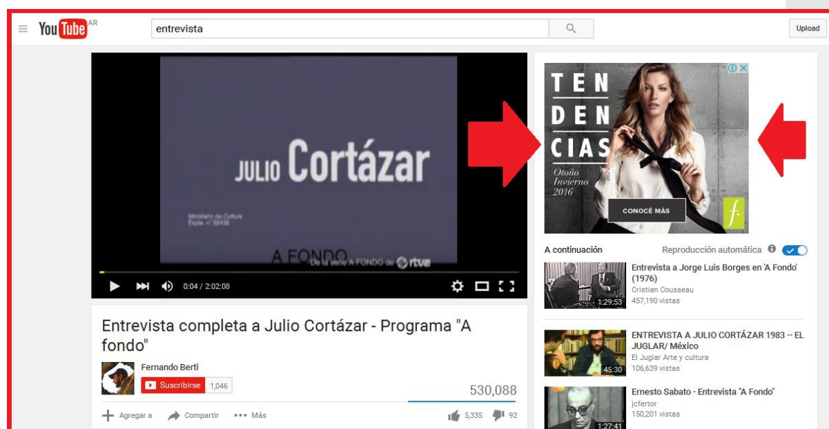
Anuncios en YouTube: Banner Estándar durante la reproducción del video.