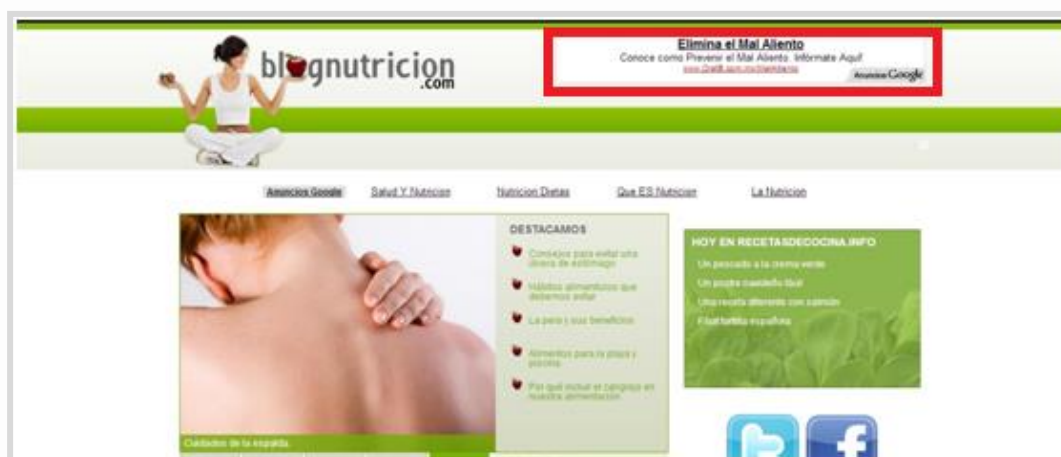
Figura 2: Anuncio de texto