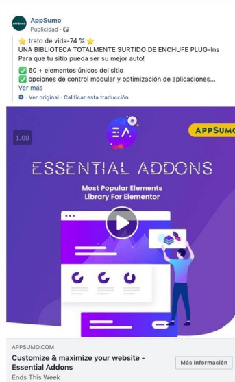
Figura 7: Anuncio de video en la sección feed de Facebook

Se puede elegir entre distintas opciones de anuncios y diferentes ubicaciones dentro de la navegación de los usuarios.