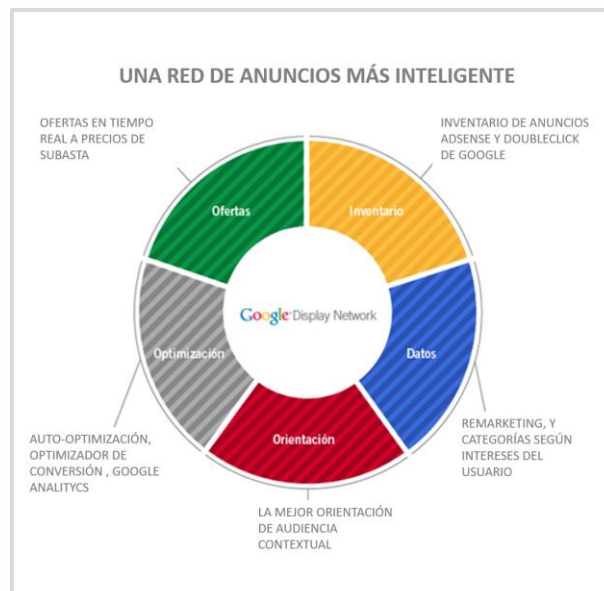
Figura 1: GDN y sus características

Esta red, a su vez, se compone de muchos publishers (webs con espacio publicitario) y permite que los anunciantes publiquen anuncios en los espacios publicitarios correspondientes y poder así lograr su cometido de llegar a los usuarios (Tozzi, s.f., https://madiba.me/blog-wrapper/notas/287-que-es-la-gdn-red-de-display-de-google.html )