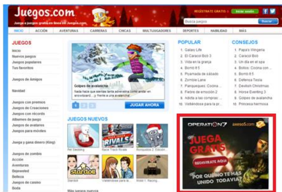
Figura 3: Anuncio de imagen