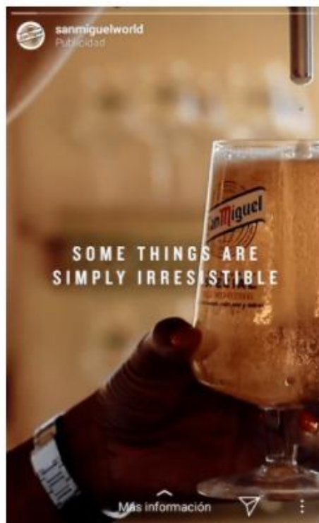
Figura 8: Anuncio de video en sección stories de Instagram