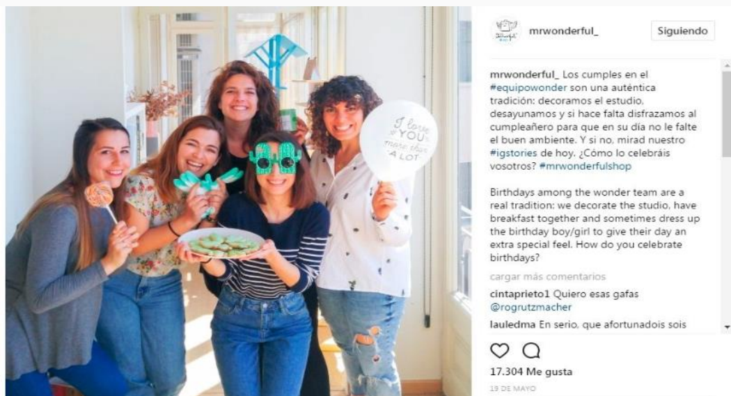
Figura 2: Ejemplo de post de Instagram