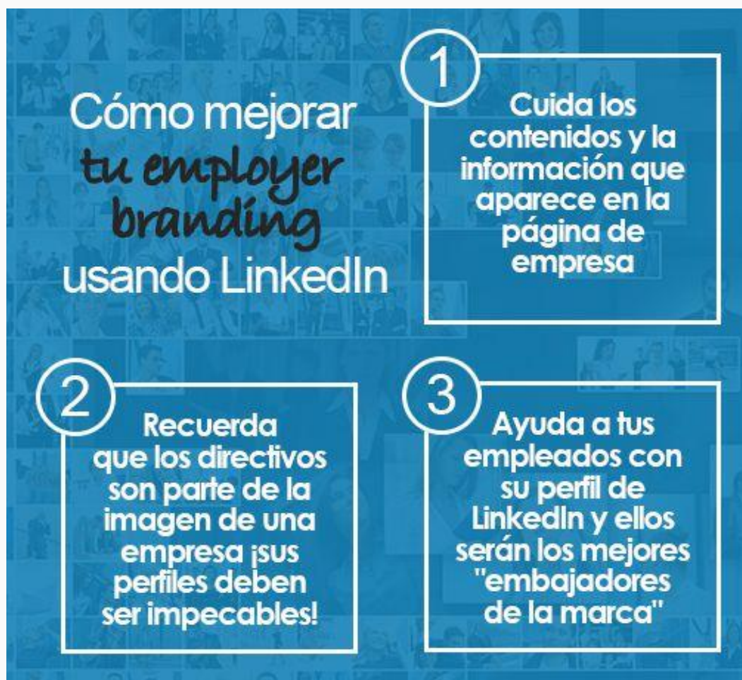
Figura 4: Cómo mejorar el employer branding en LinkedIn