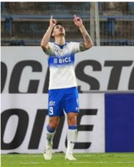
Figura 6: Jugador festejando

Los jugadores no utilizarán ningún equipamiento ni llevarán ningún objeto que sea peligroso para ellos mismos o para los demás jugadores (incluido cualquier tipo de joyas)” (FIFA, 2015, p. 22).