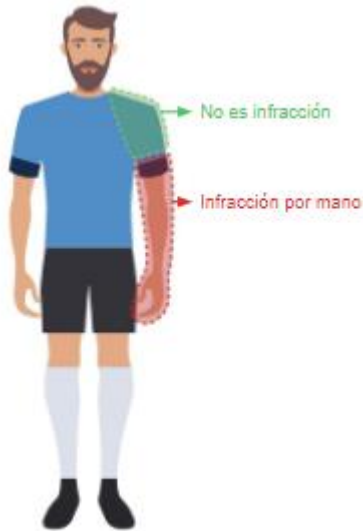
Figura 11: Zona de infracción