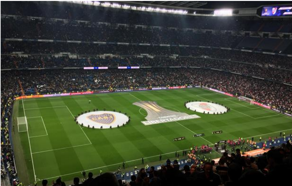
Figura 1: Terreno de juego