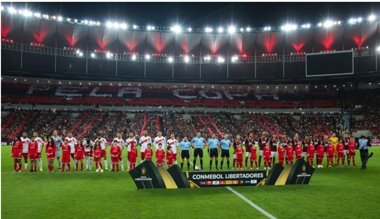
Figura 5: Jugadores