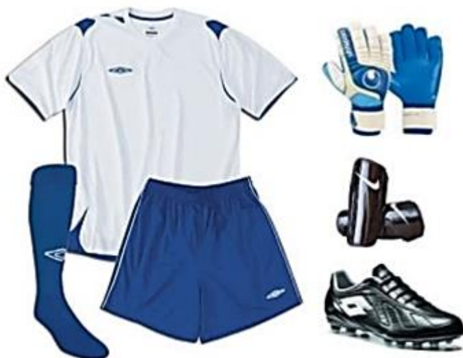
Figura 7: Equipamiento básico de un jugador de fútbol