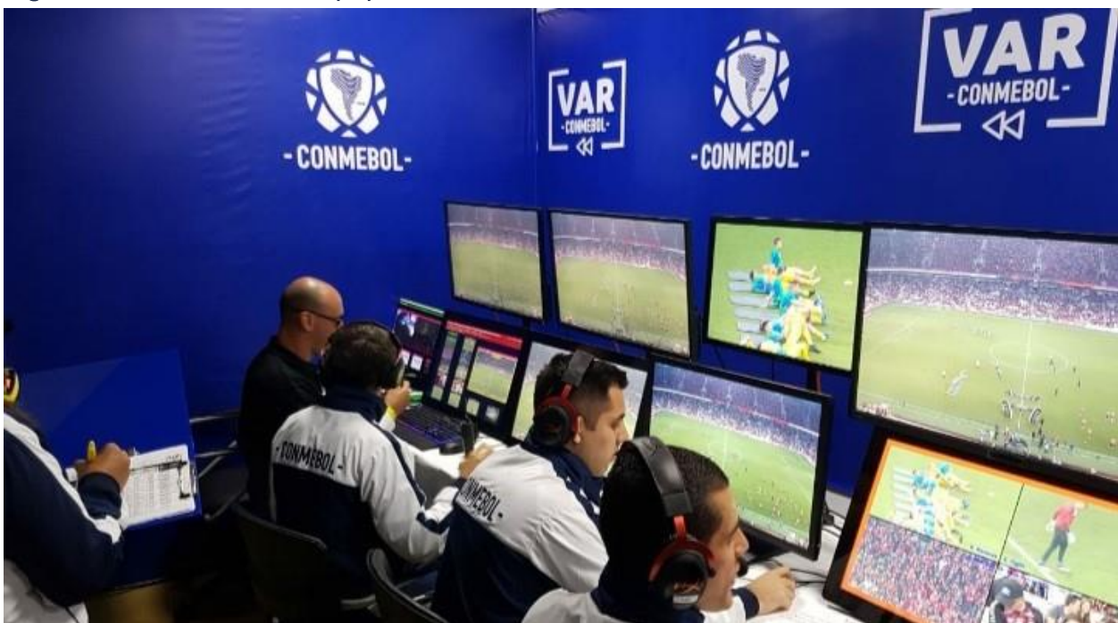
Figura 9: Miembros del equipo arbitral de video

4. Árbitro asistente de reserva: Si es designado, será únicamente para reemplazar al árbitro asistente o cuarto árbitro.