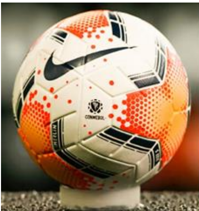
Figura 4: Pelota de fútbol