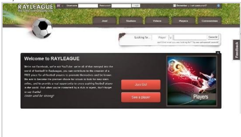
Рисунок 7: Рэлиг

Предлагается Олимпийским комитетом Испании и различными ассоциациями здравоохранения, что позволяет предположить, что их внимание сосредоточено на спортивном благополучии через здоровую практику. Для этого у вас есть информация о заболеваниях, рекомендации, предложения по питанию, контакты со специалистами и другими спортсменами, тесты на лучшую умственную работоспособность и т. д.