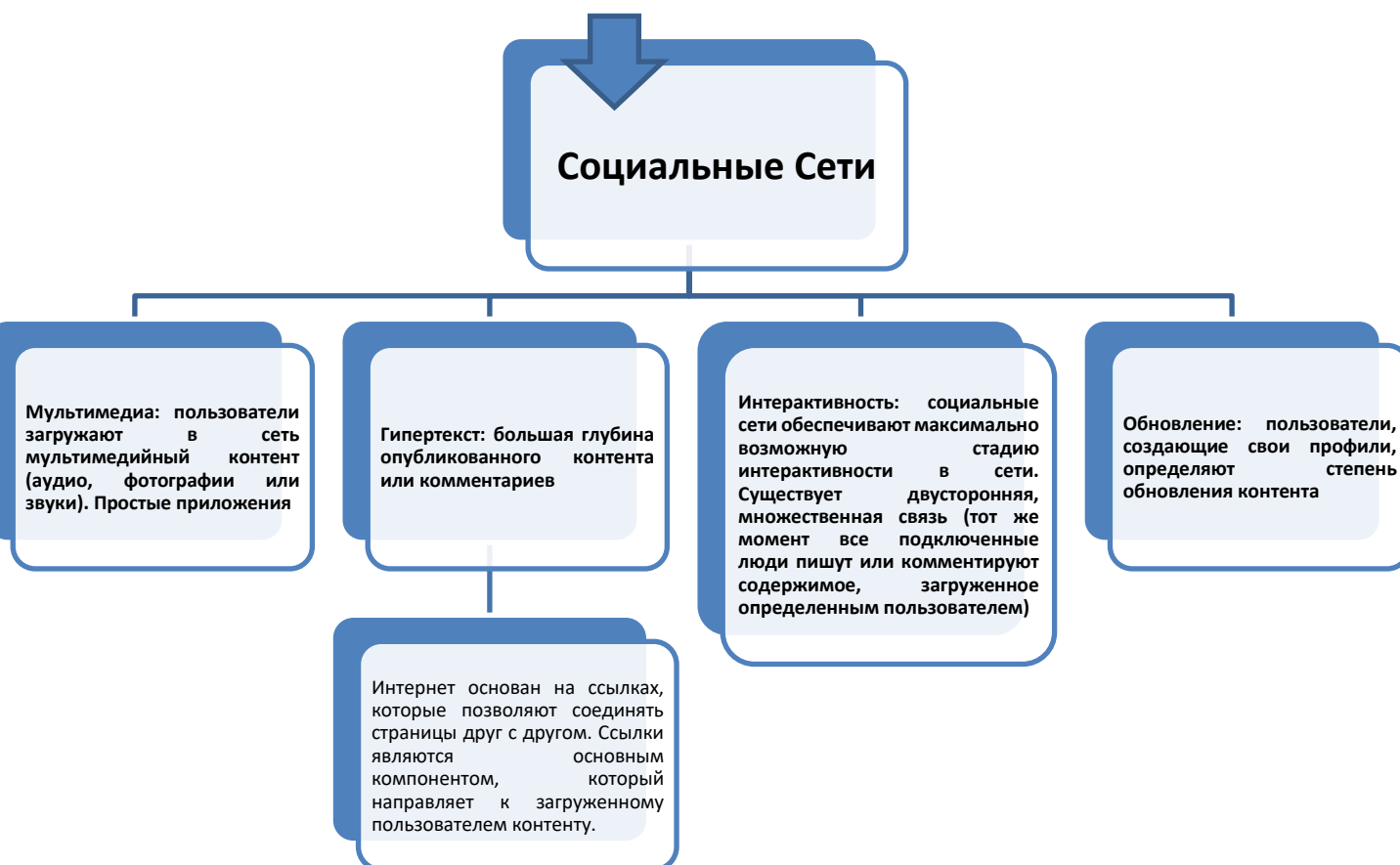
Рисунок 9: Социальные Сети

Это инструмент, который сочетает в себе все элементы, которые составляют природу интернета и подчеркивают его уникальность в коммуникативной системе.