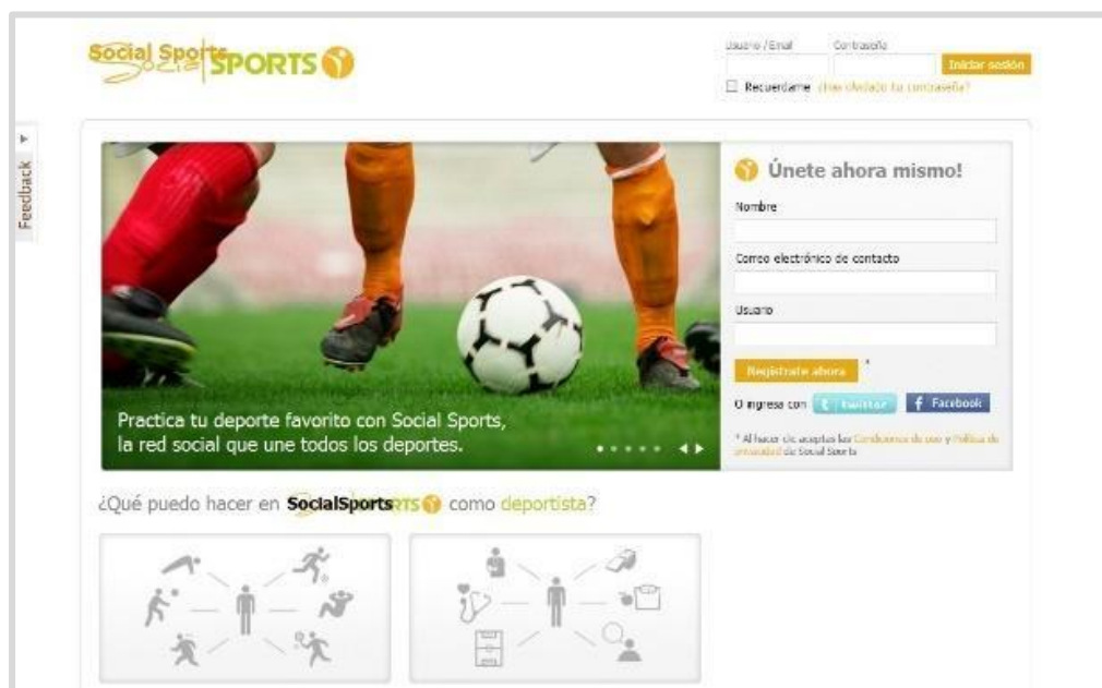
Рисунок 8: SocialSports

имидж, чтобы сделать его доступным для охотников за талантами или заинтересованных клубов.