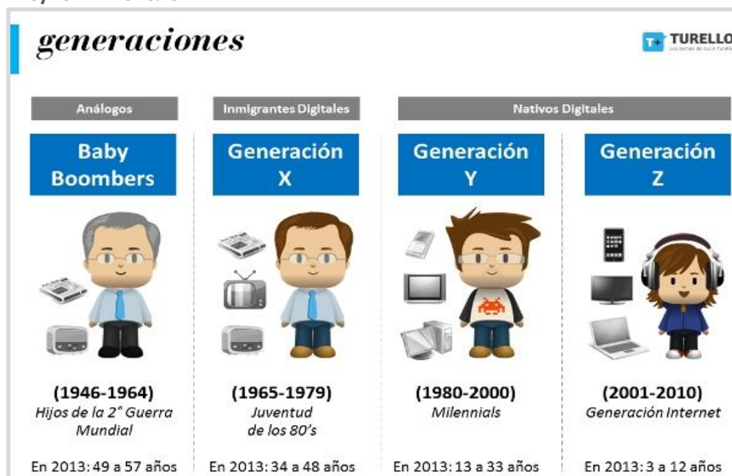
Рисунок 1. поколения