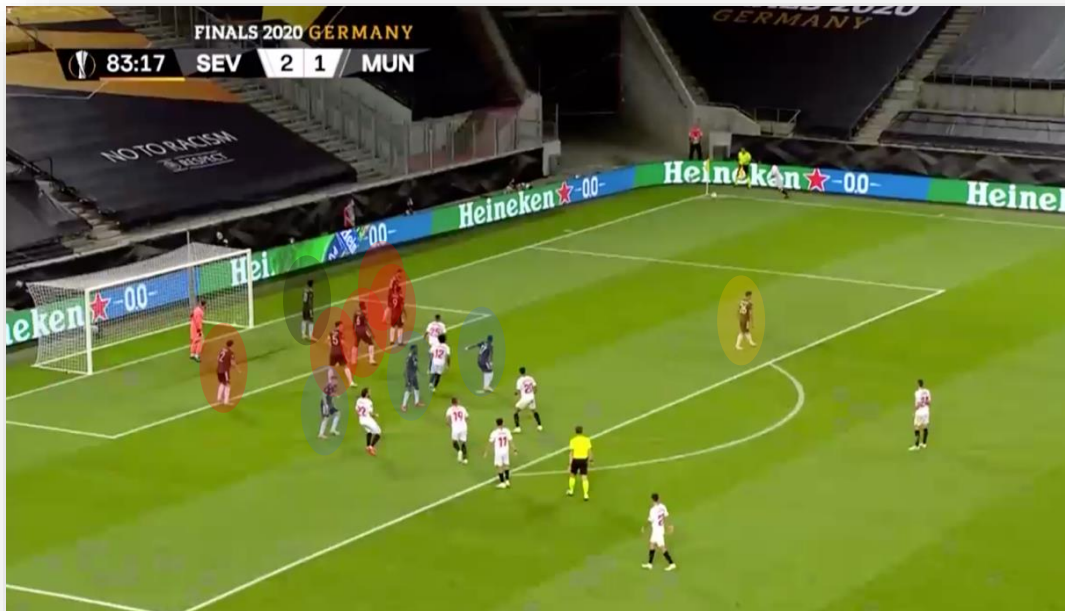
Figura 3: Estructura 1-5-3-1