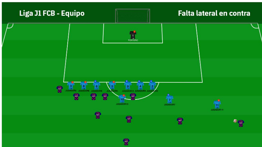
Figura 16: Representación 2D (prepartido) estructura en falta lateral en contra