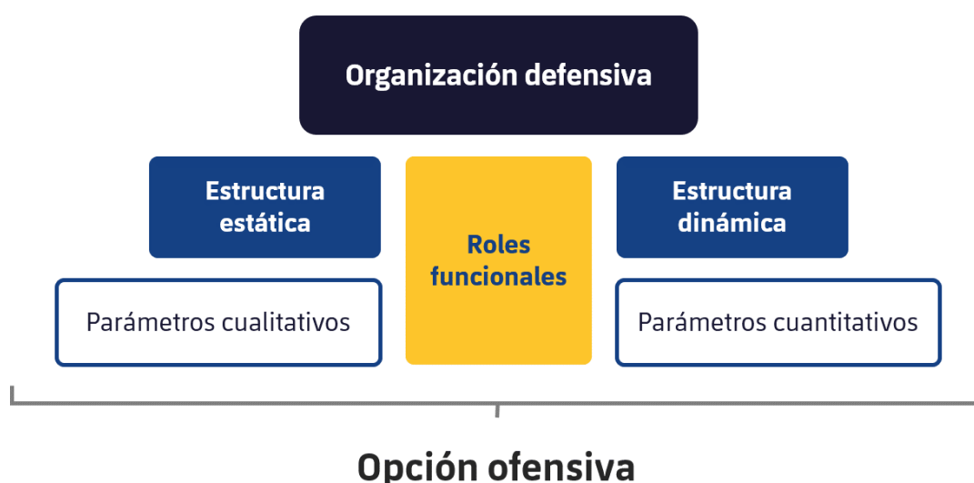
Figura 7: Variables de análisis en un córner defensivo

Dependiendo del rol o función del analista de ABP dentro del equipo, esta opción propuesta será más o menos extensa y detallada. Aun así, siempre se tratará de una opción específica para ese partido en concordancia con aquellos puntos débiles observados del equipo rival, que podemos explotar mediante nuestras fortalezas en un saque de esquina.