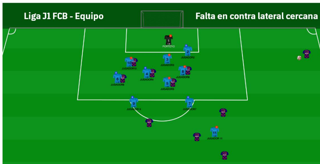
Figura 17: Representación 2D (prepartido) estructura en falta lateral cercana en contra