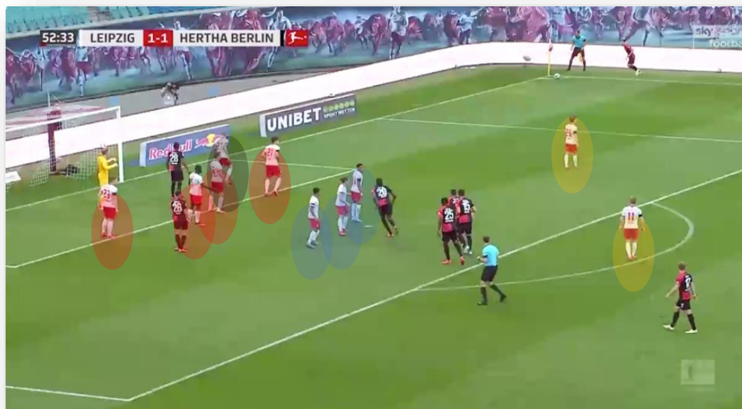
Figura 1: Estructura 1-4-3-2