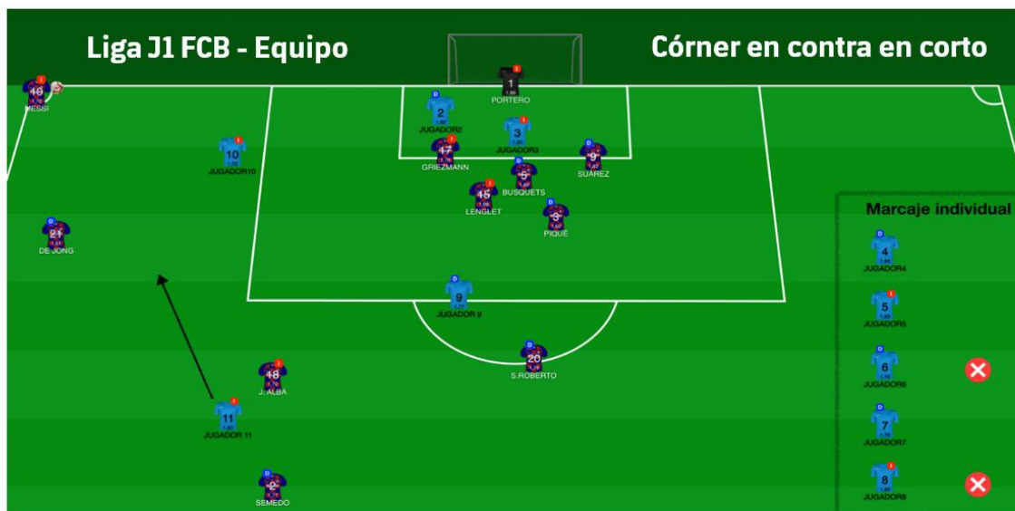
Figura 12: Informe partido in situ ABP (córner en contra en corto)