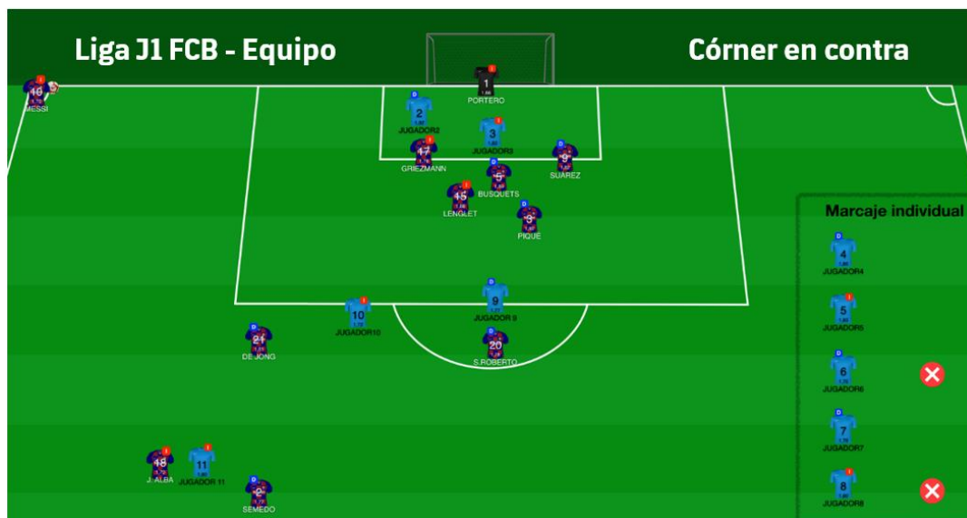
Figura 11: Informe partido in situ ABP (córner en contra)