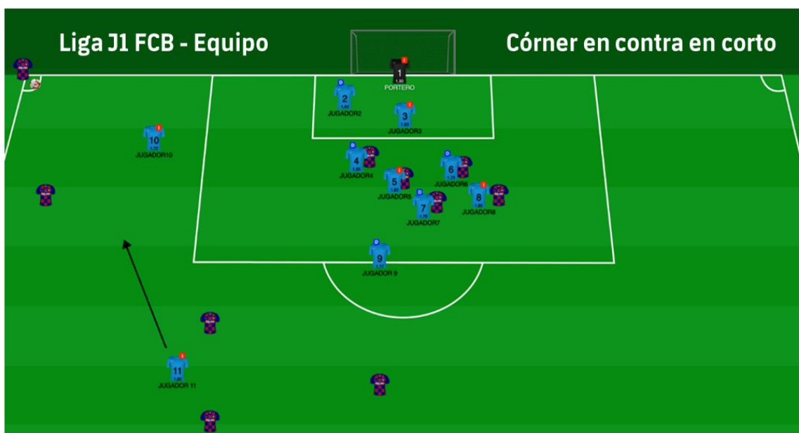
Figura 10: Representación 2D (prepartido) estructura en córner en contra corto