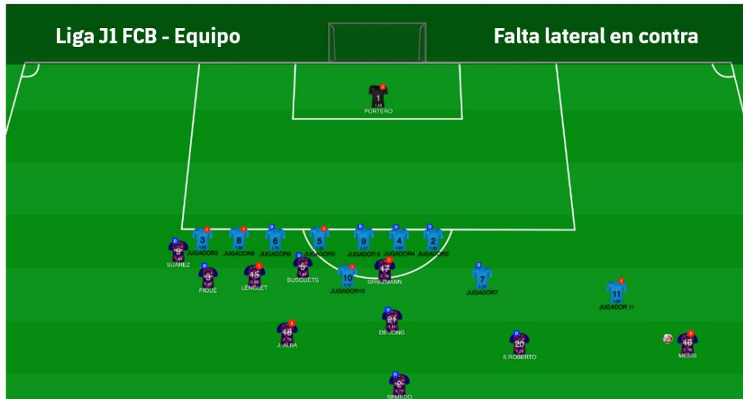
Figura 18: Informe partido in situ ABP (falta lateral en contra)