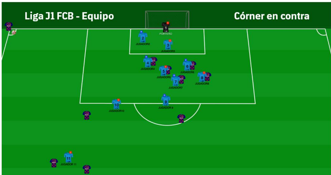
Figura 9: Representación 2D (prepartido) estructura en córner en contra