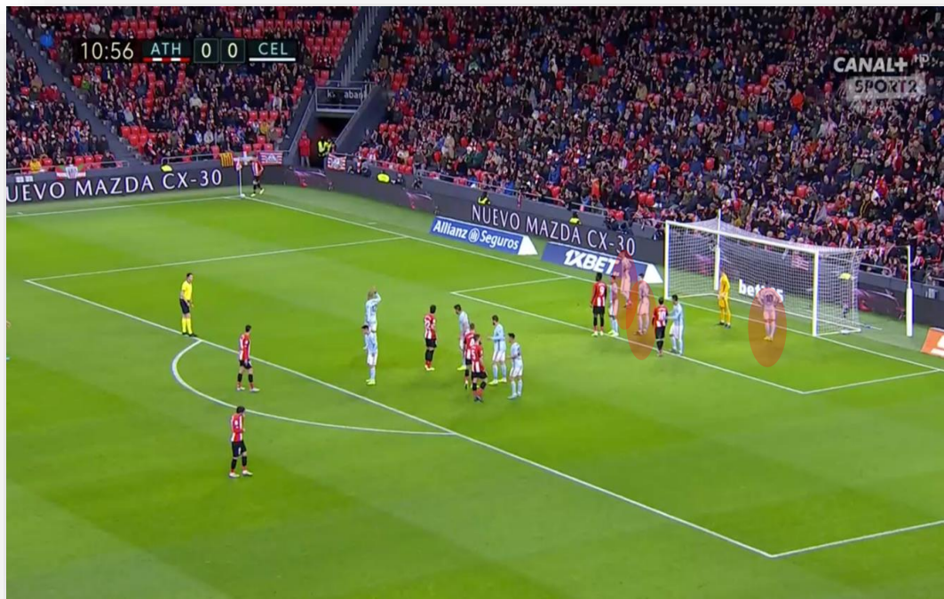
Figura 5: 1.º palo, frontal de área pequeña y 2.º palo (3 en zona)