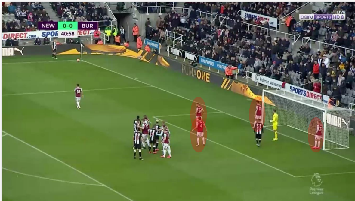
Figura 6: 1.º palo, frontal área pequeña y los dos palos (4 en zona)