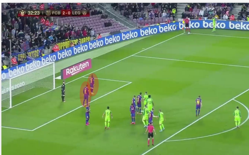
Figura 4: 1.º palo y frontal de área pequeña (2 en zona)