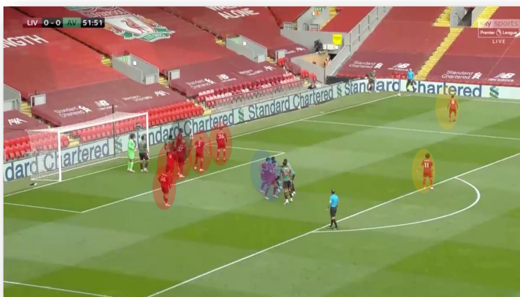
Figura 2: Estructura 1-5-2-2