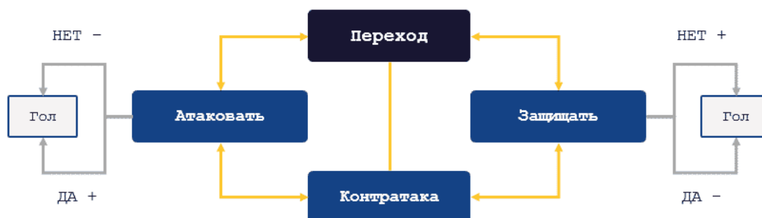
Рисунок 5: Стратегии традиционного футбола