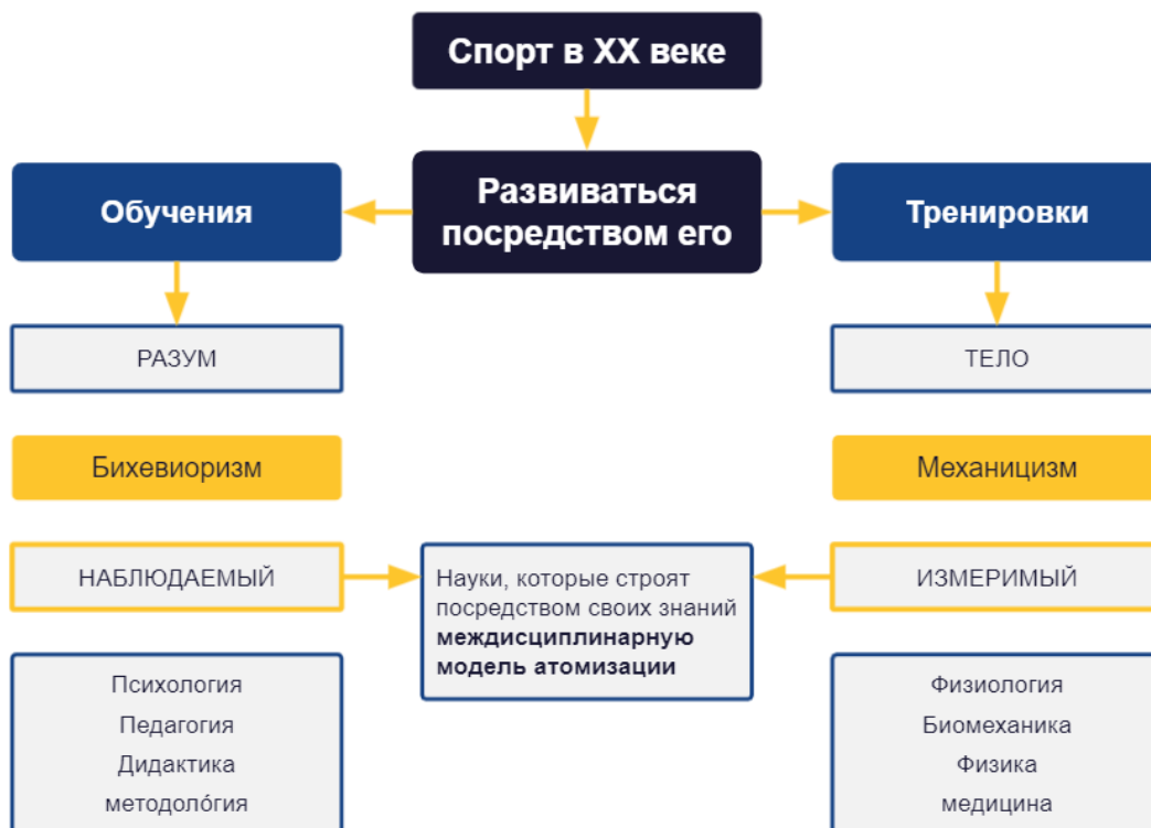
Рисунок 1: Спорт в XX веке

В теории динамических систем (ТДС) целое понимается как нечто большее, чем сумма его частей. Привнесенная в мир спортивной тренировки, она создает методологические предложения, в которых упражнение концептуализируется и тесно связано с реальностью его исполнения. Физические способности спортсмена сосуществуют все одновременно и не функционируют отдельно друг от друга. При постоянном столкновении с меняющимися контекстами приобретаемые навыки должны следовать схеме постоянных изменений.