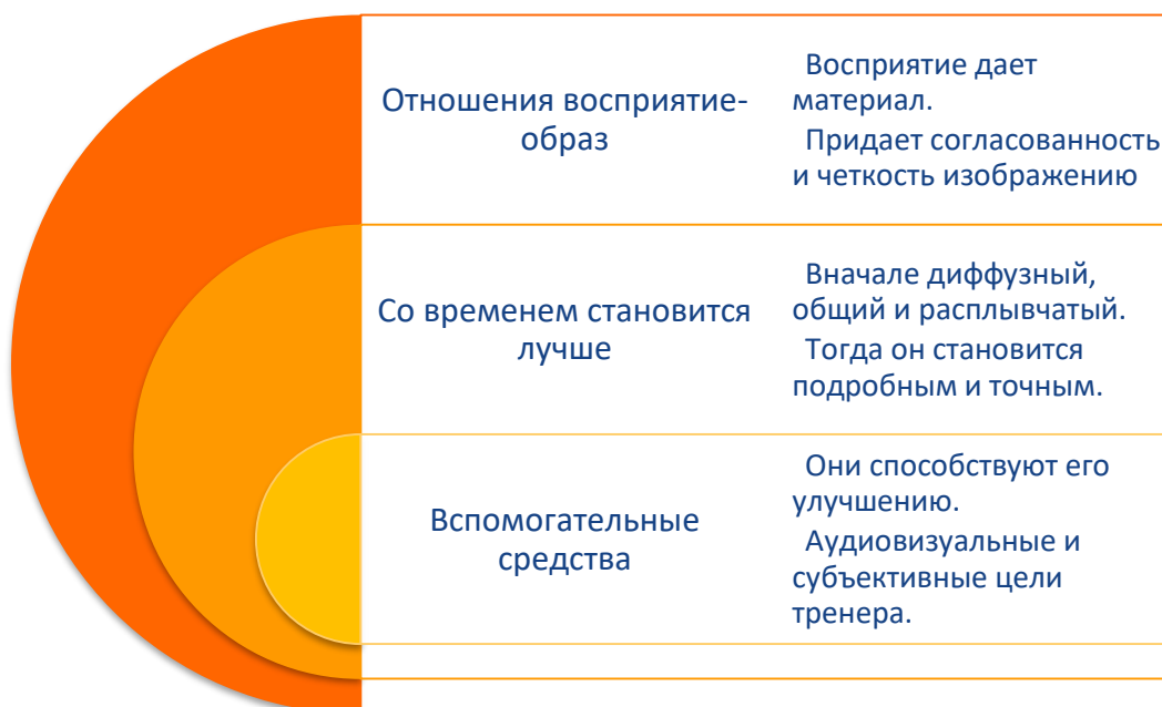
Рисунок 1: Интеграция движущихся изображений