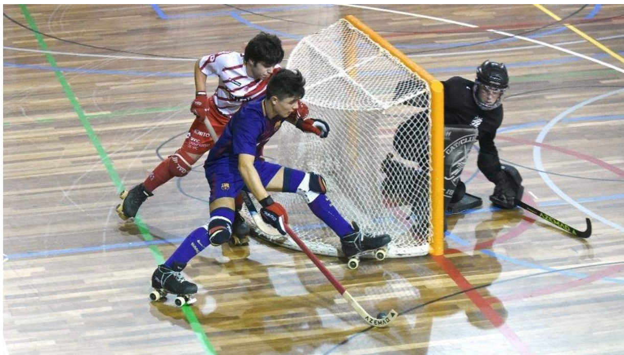
Figura 5: Protecciones utilizadas en el hockey patines

Jugador: espinilleras, rodilleras, protección testicular, protector bucal, guantes. El casco es, hasta el momento, opcional, sobre todo en categorías inferiores. Se ha propuesto que la próxima temporada el uso de casco en los jugadores de campo sea obligatorio en todas las competiciones (Figura 5).