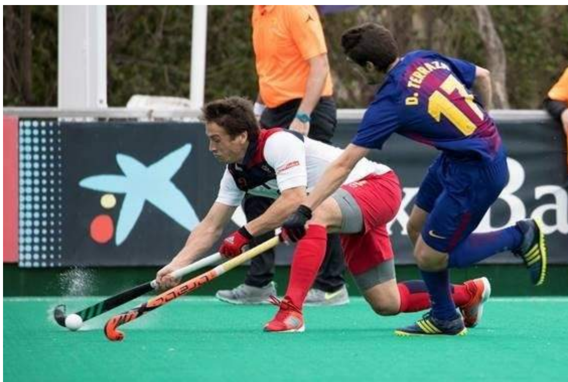
Figura 1: Posición ofensiva (izquierda) y posición defensiva (derecha) en hockey hierba

cadera y rodilla y con el stick a ras de suelo (Figura 1), conlleva una sobrecarga importante de la región lumbar y pélvica.