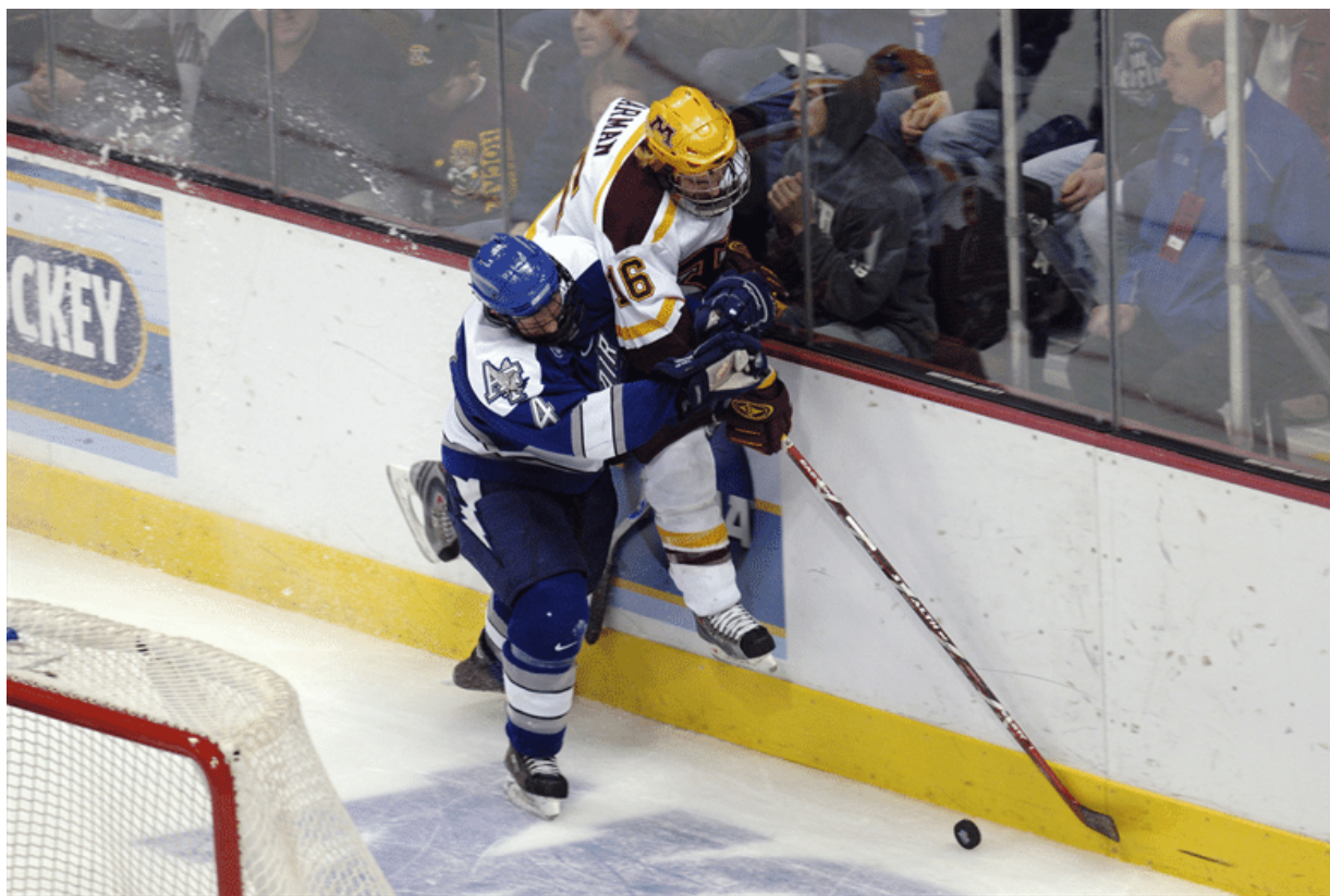
Figura 7: Body check contra las protecciones laterales de la pista. Situación de juego con gran riesgo lesional