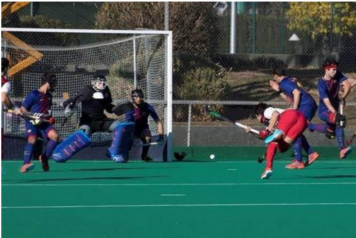
Figura 3: Protecciones de portero y máscaras de protección utilizadas en el lanzamiento de penalty corner en hockey hierba

puede llegar a los 130 km/h en hombres y 100 km/h en mujeres. Debido a las múltiples lesiones por contusión directa que se causaban en este tipo de jugada, se instauró el uso de máscaras y guantes protectores (Figura 3) en los jugadores defensivos. En el sexo masculino se usa también protección testicular