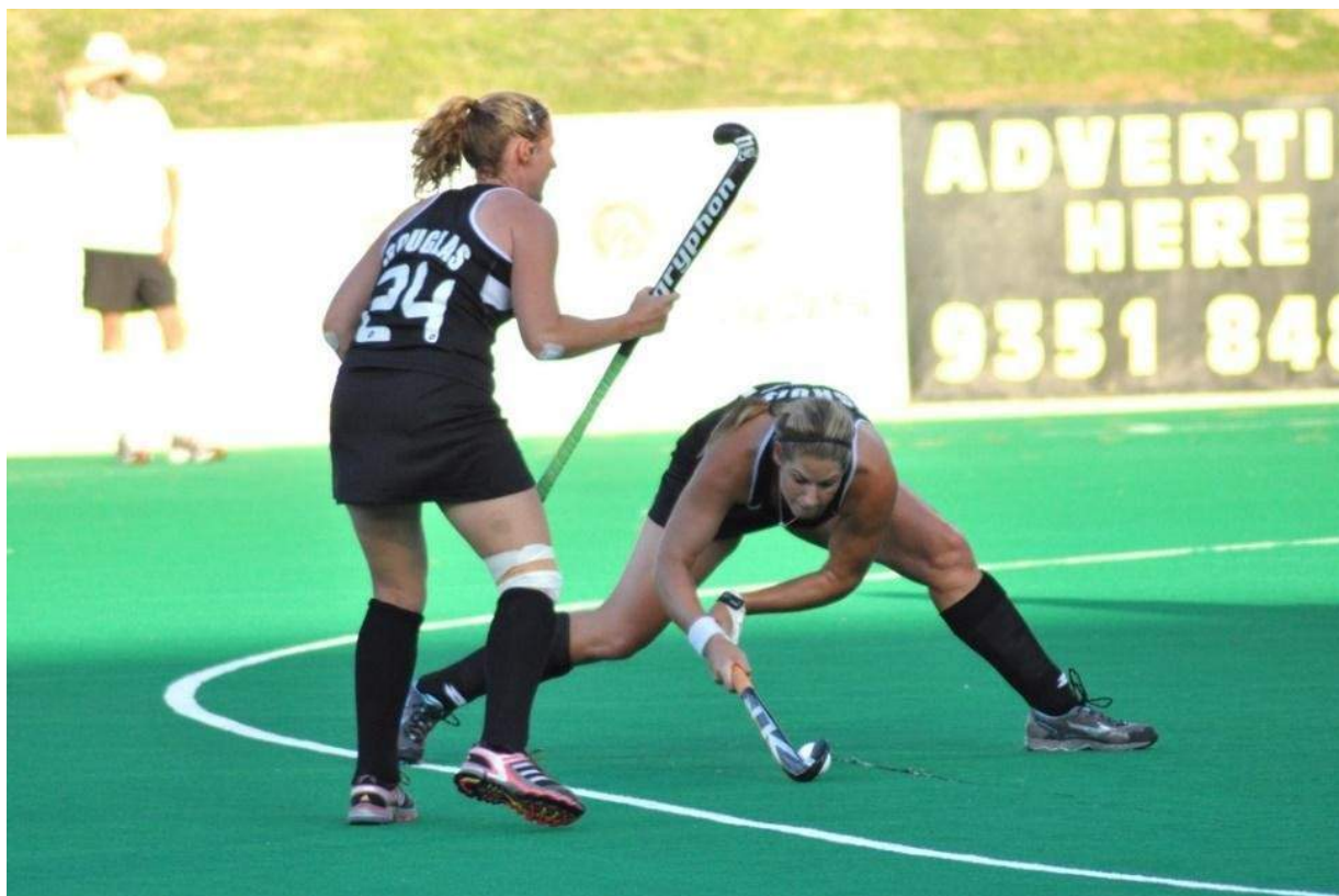
Figura 2: Postura típica del tirador de penalty corner en hockey hierba