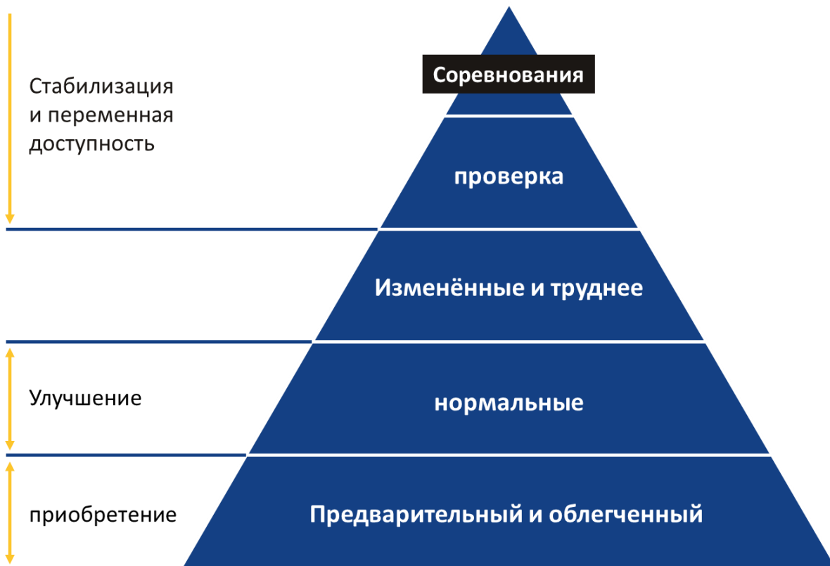
Рисунок 2: Этапы и фазы