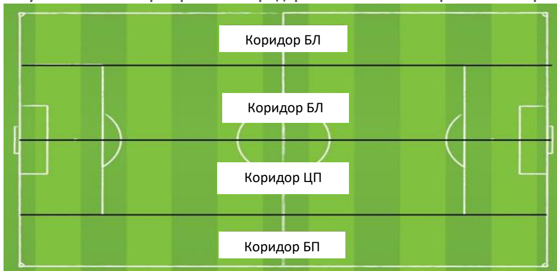
Рисунок 3: Занятие пространств в коридорах в соответствии с развитием игры