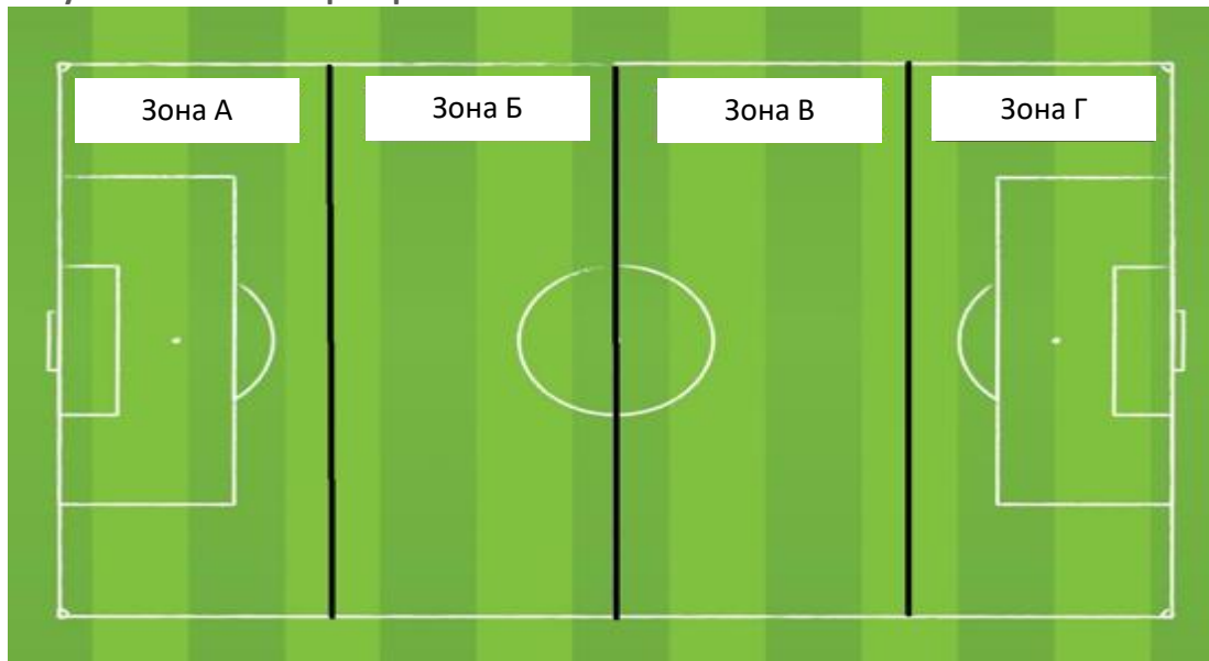
Рисунок 2: Занятие пространств по зонам

Такие игровые ситуации обычно происходят в определенных зонах поля. Поперечно разделяя игровое поле на 4 части, появляются названия зон: тревоги (А), благосостояния (Б), контроля (В) и определения (Г). Если мы посмотрим на команду, которая владеет мячом, то в А произойдут игровые ситуации, связанные с выходом в атаку . В зоне Б произойдет позиционное расположение ; в зоне В - позиционное расположение перед последней линией противника , и в зоне Г - завершение .