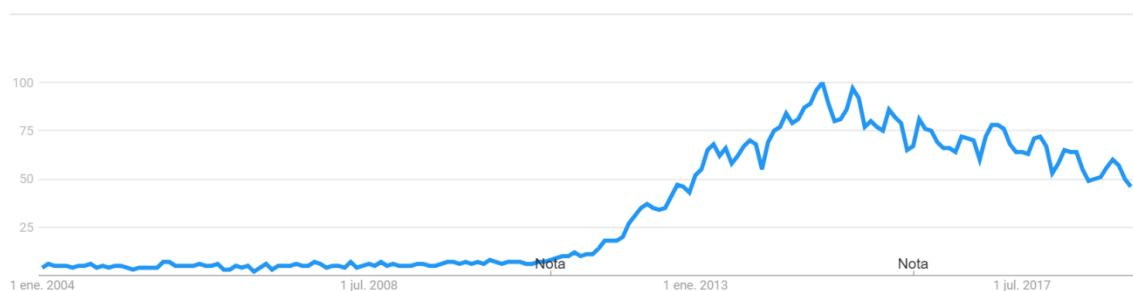
Figura 2: Big data solamente en los Estados Unidos, 2004-actualidad