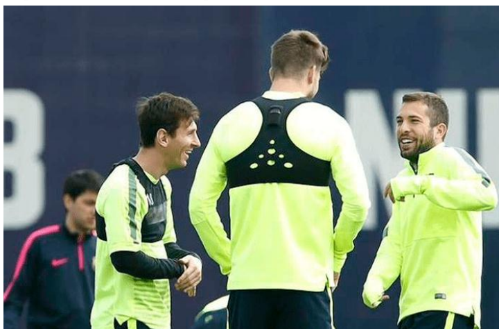
Figura 3: WimU en jugadores profesionales de fútbol