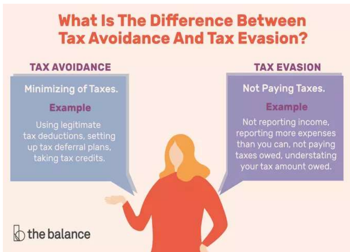
Figura 1: ¿Cuál es la diferencia entre elusión y evasión fiscal?