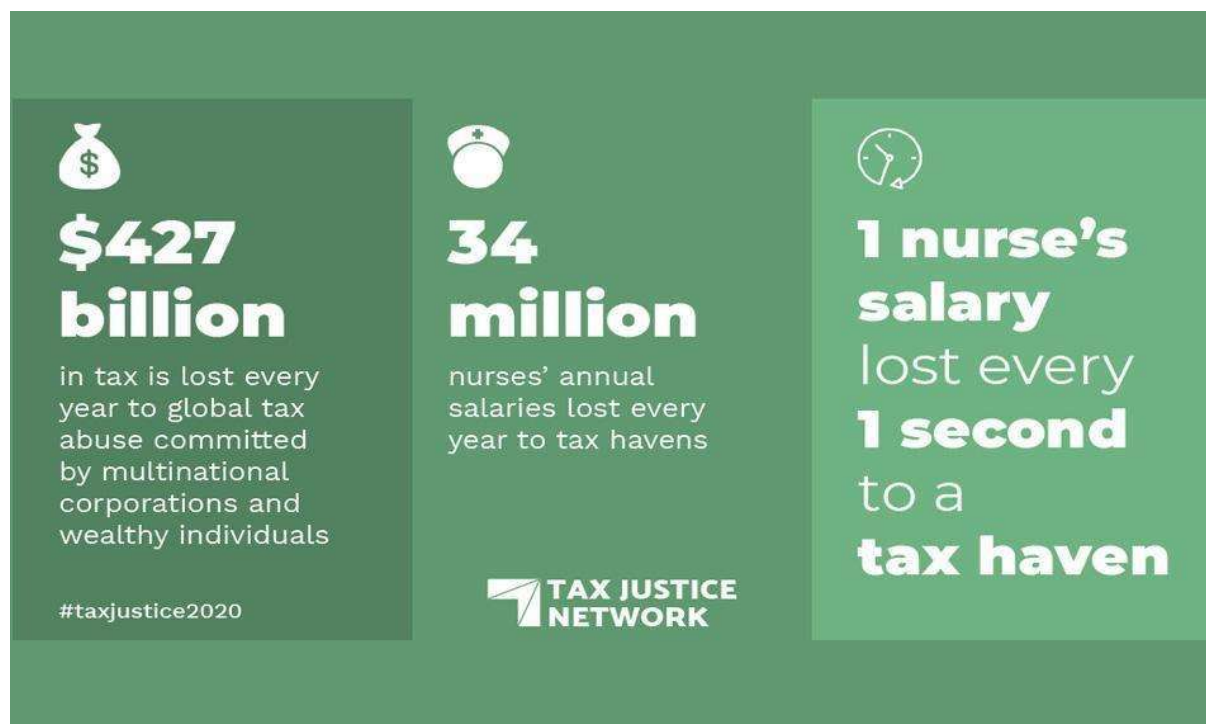
Figura 4: Costes de elusión fiscal