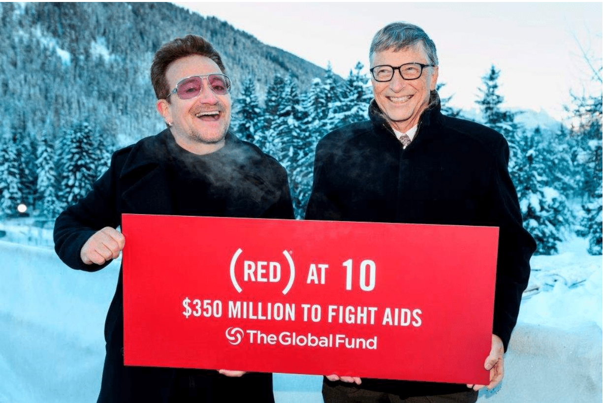
Bono posa junto a Bill Gates en la reunión anual del Foro Económico Mundial que se llevó a cabo en enero de 2015 para celebrar el décimo aniversario de Red.