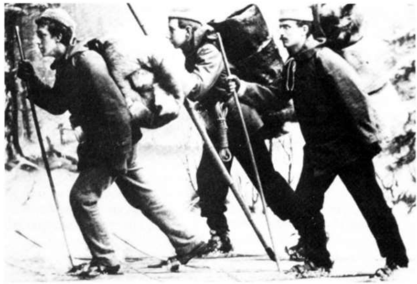
El esquí en tiempos pasados. El esquí en sus inicios se desarrollaba en un entorno poco transformado por la intervención humana. La iniciativa personal era indispensable para poder disfrutar de este deporte

El deporte debe favorecer la salud y adaptarse a las exigencias individuales. Esto ha de ser, además, con garantías de seguridad presentes y futuras. Hay una demanda creciente de deporte como medio para mantener la salud debido a la propaganda que relaciona deporte con salud ideal, al hecho que la forma física y la tranquilidad para afrontar la vida moderna se consideran bienes escasos, y a la creciente importancia que se da a la prevención de las enfermedades en contraposición a la curación de las mismas. El deporte y la salud son interpretados como algo más o menos idéntico. La industria de máquinas de musculación vive de la ilusión y la esperanza de que se puede controlar la salud (número de pulsaciones, densidad muscular, capacidad pulmo-