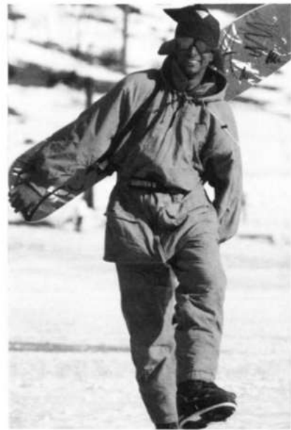
"Chico guapo". La vestimenta deportiva forma parte del consumo individual; permite crear un estilo propio con el que cada persona se diferencia de las otras

práctica física (presentación de uno mismo, distinción social), observamos una notable mejoría de la ropa para el tiempo libre. Además, en torno a este mercado surgen productos adicionales tales como camisetas, banderas, bebidas, cremas para la piel,