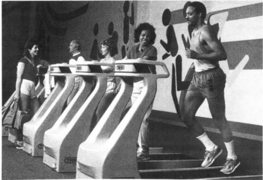
Mujeres en una sala de fitness . En contraste con las instalaciones deportivas de tipo tradicional, los espacios de prácticas deportivas ligados al consumo disfrutan de material sofisticado y recrean ambientes más confortables y a la vez más sofisticados

1. La misma práctica de deporte tal y como se realiza en los centros deportivos comerciales, salas de fitness , centros de danza y escuelas deportivas. Lo que aquí se practica no es el deporte en el sentido tradicional. En estos lugares se vende con éxito la puesta a punto, la salud, cuerpos estilizados, bienestar. La oferta va directamente orientada a satisfacer las aspiraciones del cliente (adelgazar, mejorar la forma, encontrarse mejor,