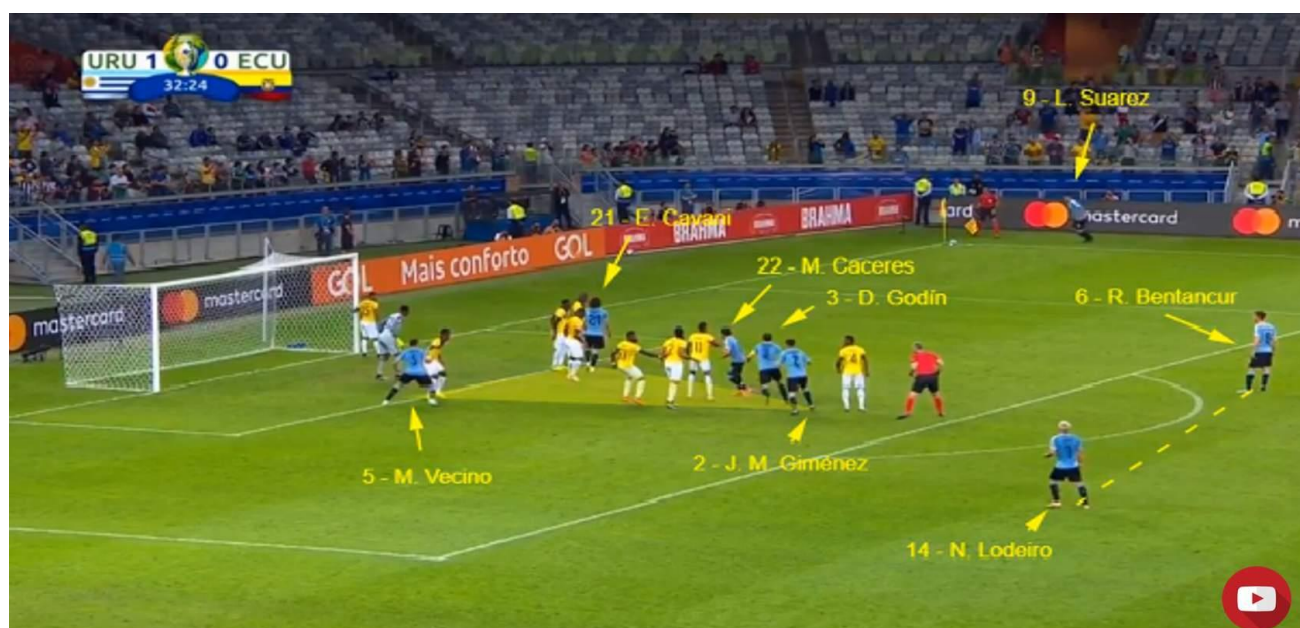
Figura 6: Escanteios ofensivos (a favor)

O que o adversário faz em cada tipo de bola parada e recomposição quando atacando. Mostre os pontos fortes e fracos. Exemplifique com bons vídeos cada uma das bolas paradas. Quais as características coletivas e individuais nessas cobranças?