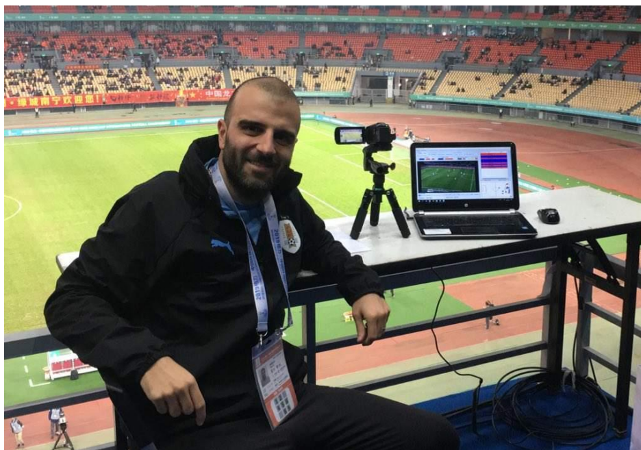
Figura 11: Análise ao vivo câmera + laptop

Existem treinadores que solicitam informações o tempo inteiro, outros a cada 15 min. e outros no intervalo. Saiba qual será a melhor dinâmica para sua equipe.