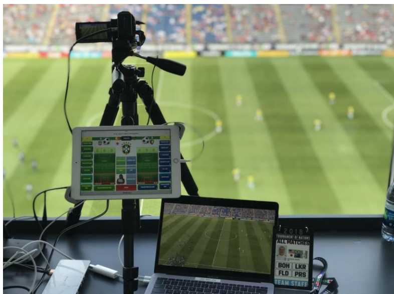
Figura 9: Análise ao vivo com laptop + câmera