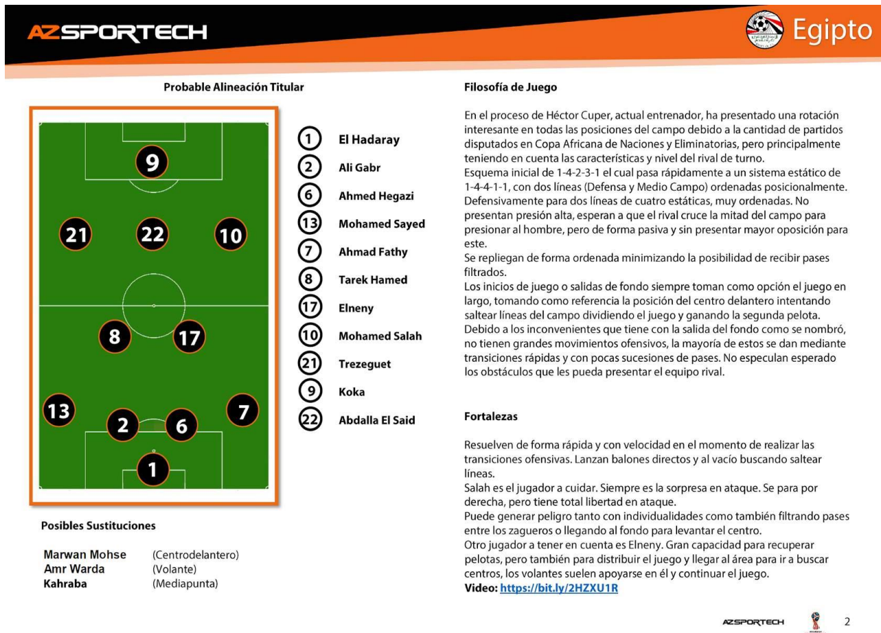
Figura 3: Exemplo de análise do modelo de jogo do oponente