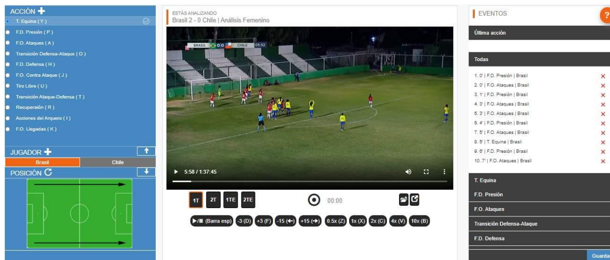
Figura 2: Exemplo de sistema de análise de jogo dividido em eventos