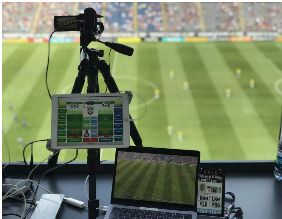
Figura 10: Análise ao vivo com câmera + capturador + iPad + laptop

Por muitas vezes analistas marcam o tempo de ocorrências de extrema importância e levam até o vestiário para apresentar ao treinador no próprio aparelho celular, filmadora ou usando um computador com o cartão de memória utilizado na gravação no primeiro tempo.