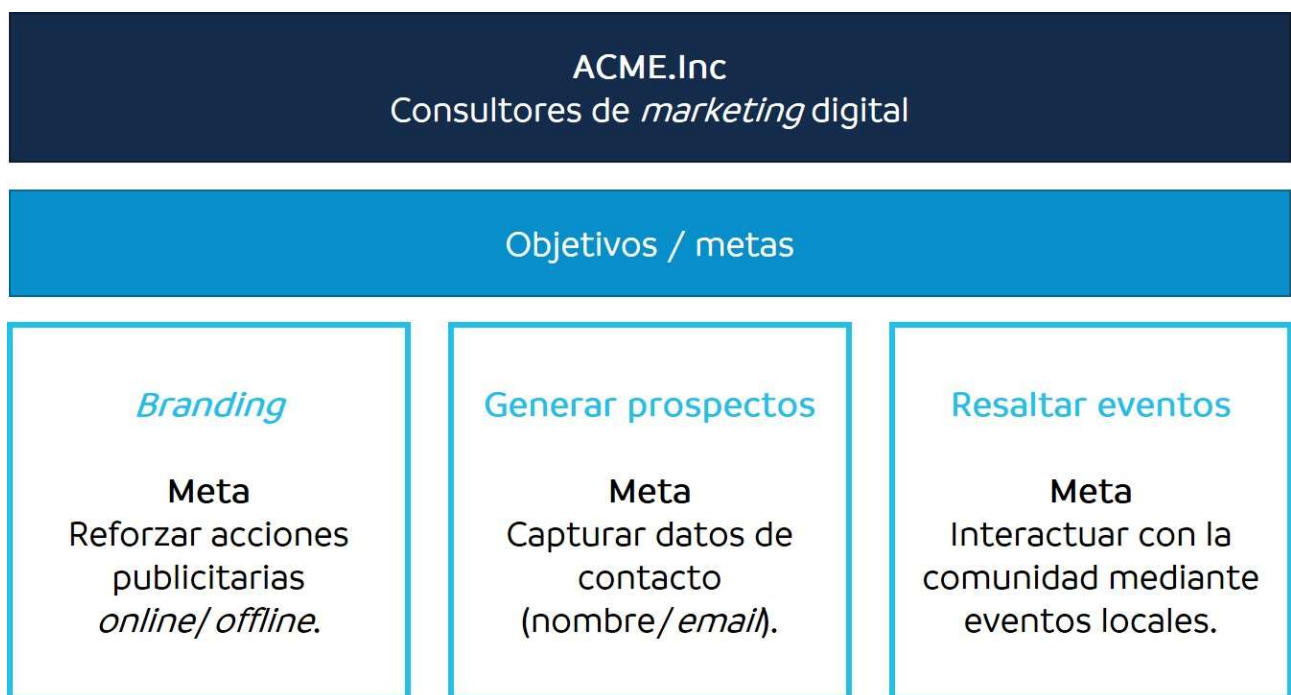
Figura 1: Ejemplo de cómo se alinean los objetivos y metas

Y como sabemos, los objetivos deben ser seleccionados y definidos cuidadosamente, ya que no contar con objetivos apropiados, nos llevará a que nuestras metas sean inapropiadas, y con ello a estrategias y tácticas erradas.