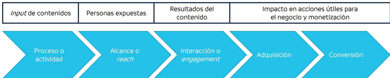
Figura 1: Métricas de social media

Como mencionamos anteriormente, las métricas o indicadores deben estar asociados inicialmente con los objetivos de negocio. Dentro de este enfoque se pueden enmarcar una serie de métricas de redes sociales que permitan evaluar el resultado de las acciones desde cinco áreas distintas.