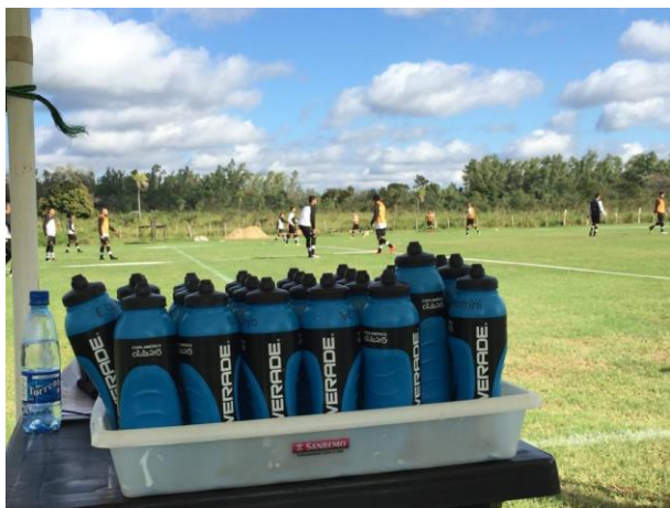
Figura 3: Batido con proteínas de suero en polvo