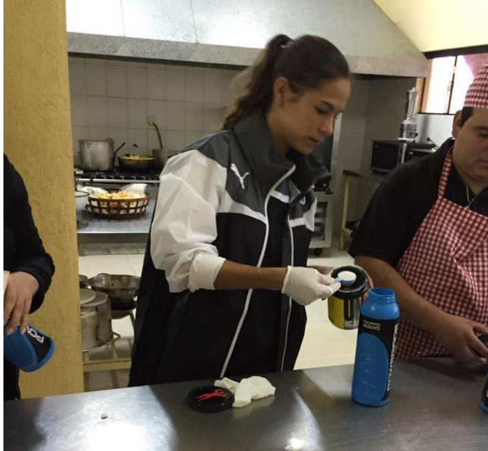
Figura 5: Preparación de suplementos según cada necesidad