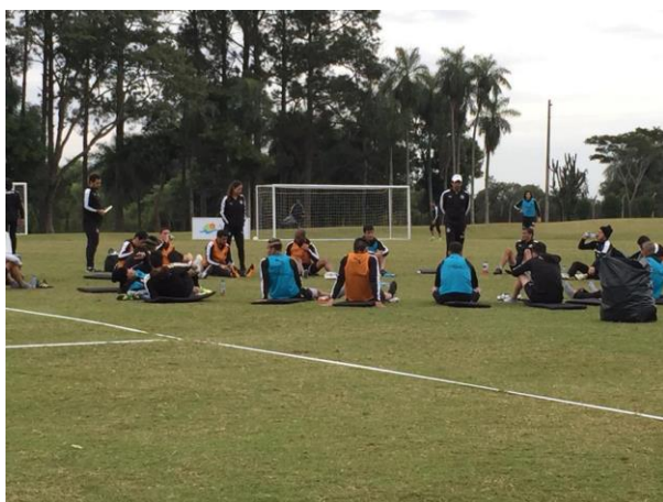
Figura 4: Uso de suplementos durante el estiramiento

Fuente: Distribución de suplementos durante el estiramiento en una pre temporada. Bedoya, 2015. Archivo propio, inédito