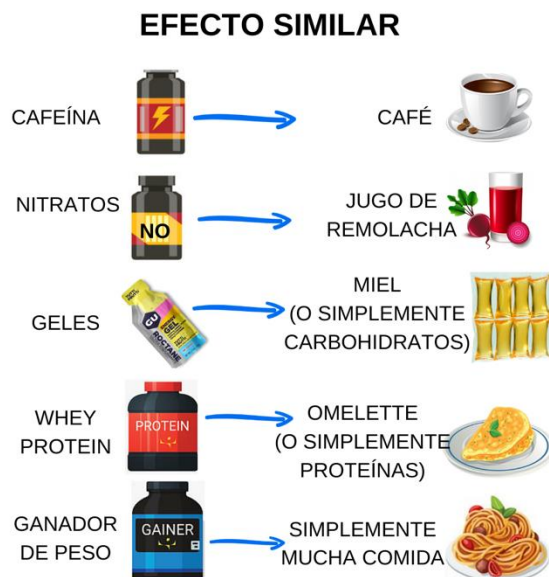
Figura 7: Efectos similares entre suplementos y alimentos reales