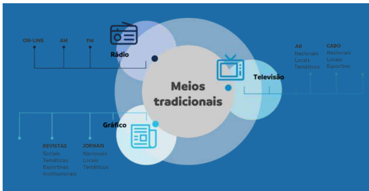
Figura 1: meios tradicionais