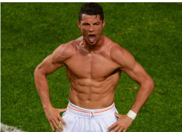
Figura 6. CR7