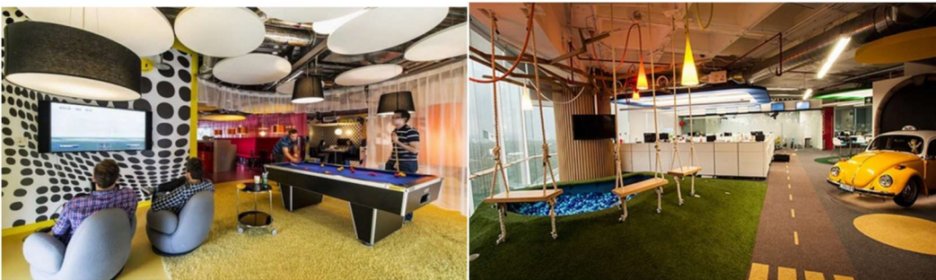
Figura 5. Oficinas de Google