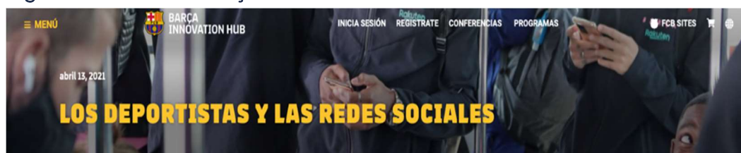
Figura 2. Curso en Barça Innovation Hub

En el Barça Innovation Hub se publicó un curso que aborda este tema.