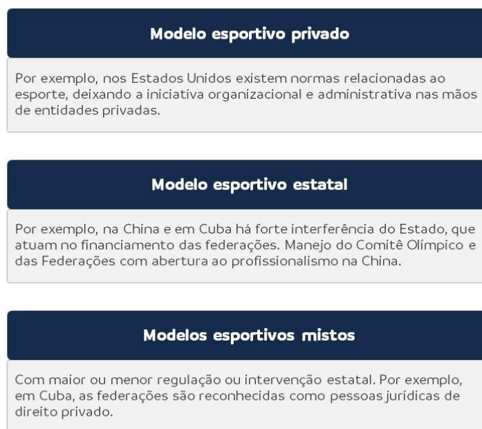
Figura 5: Modelos de relacionamento do Estado com o esporte em direito comparado

O Estado garantirá um sistema penitenciário que garanta a reabilitação da pessoa e o respeito aos seus direitos humanos. Para isso, os estabelecimentos penitenciários terão espaços de trabalho, estudo, esporte e lazer, funcionarão sob a direção da gestão respectiva, com credenciais acadêmicas e serão regidos por uma administração descentralizada, a cargo dos governos estaduais ou municipais, podendo ser submetidos às modalidades de privatização. Em geral, serão preferidos o regime aberto e o caráter de colônias agrícolas penitenciárias. Em qualquer caso, as fórmulas para o cumprimento das penas privativas da liberdade serão aplicadas preferencialmente às medidas de caráter privativo. O Estado criará as instituições necessárias para a assistência pós-penitenciária que possibilitem a reinserção social do ex-recluso(a) e promoverá a criação de uma entidade penitenciária autônoma com pessoal exclusivamente técnico. 24