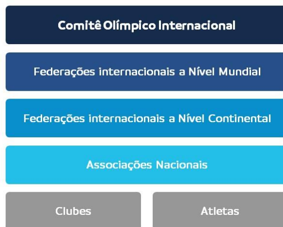
Figura 4: Organização esportiva no mundo

A comercialização dos referidos direitos, conforme visto nos parágrafos anteriores, é realizada pela CONMEBOL, sendo a titular original deles. Entretanto, não se deve esquecer que, por ser uma entidade sem fins lucrativos, os benefícios econômicos não representam o fim da organização, mas sim um meio para atingir os objetivos desta.