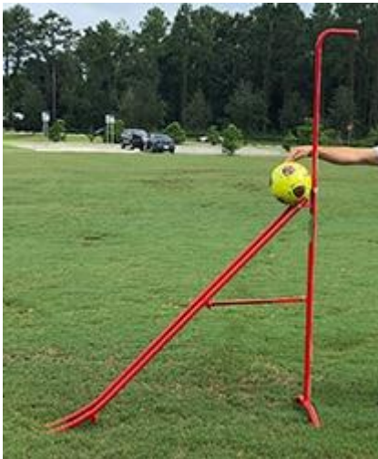
Figura 10: Prueba de balanceo de la pelota.