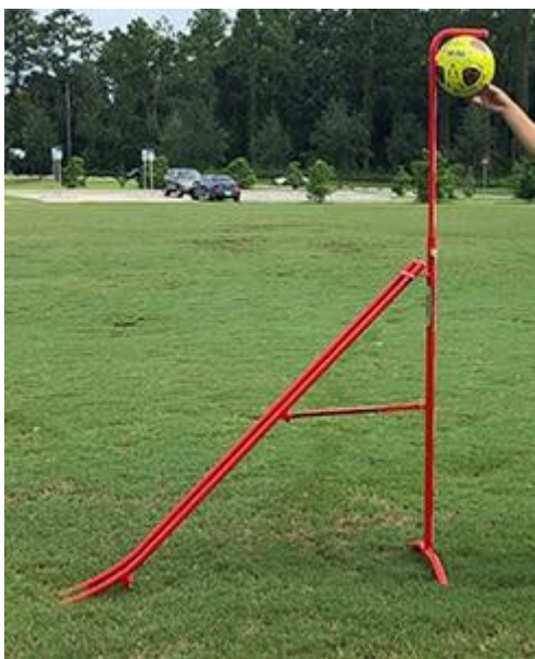
Figura 9: Rebote vertical de la pelota.