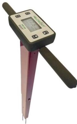
Figura 3: Sensor de humedad del suelo.