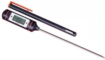
Figura 11: Termómetro digital.