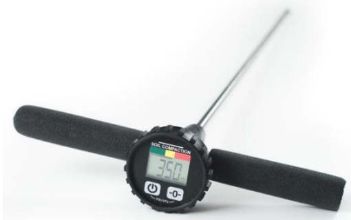
Figura 4: Penetrómetro.