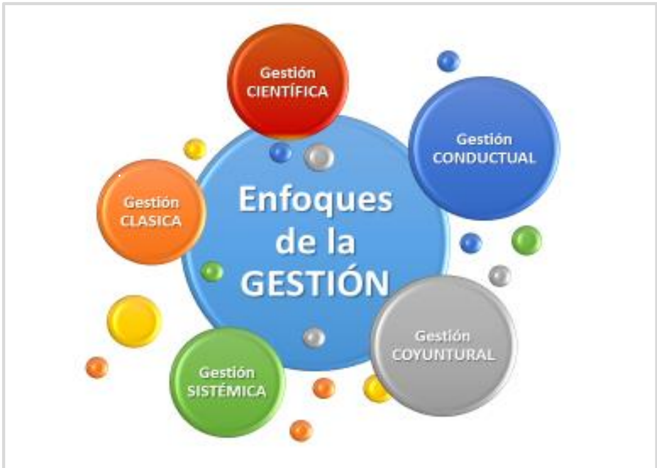
Figura 5: Enfoques de la gestión