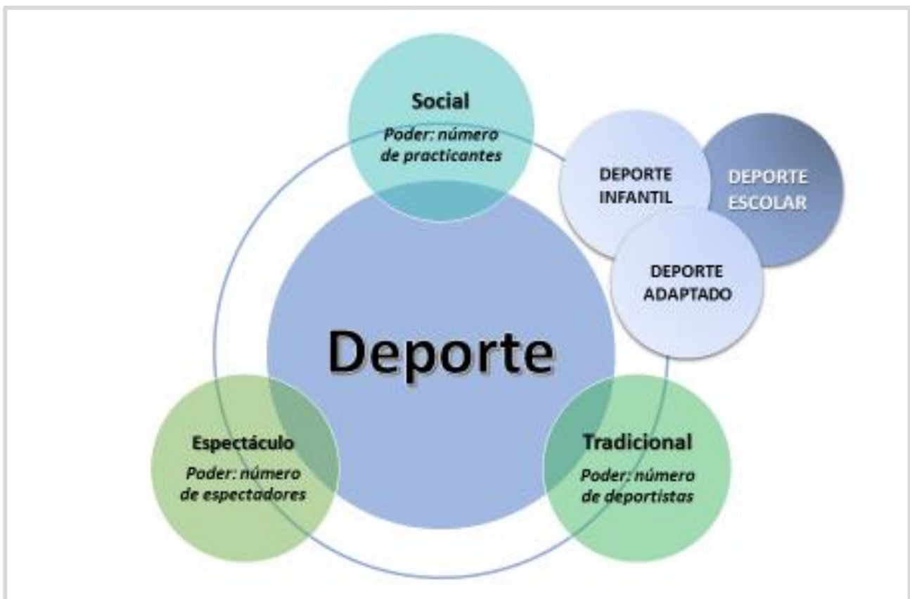
Figura 2: Mundo deporte

A continuación, se presenta una imagen que puede ayudar a identificar cuáles son los ámbitos que componen e influyen sobre este mundo que es hoy el deporte. En la figura podemos observar las diferencias entre el deporte espectáculo, el deporte social y el originario o deporte tradicional.