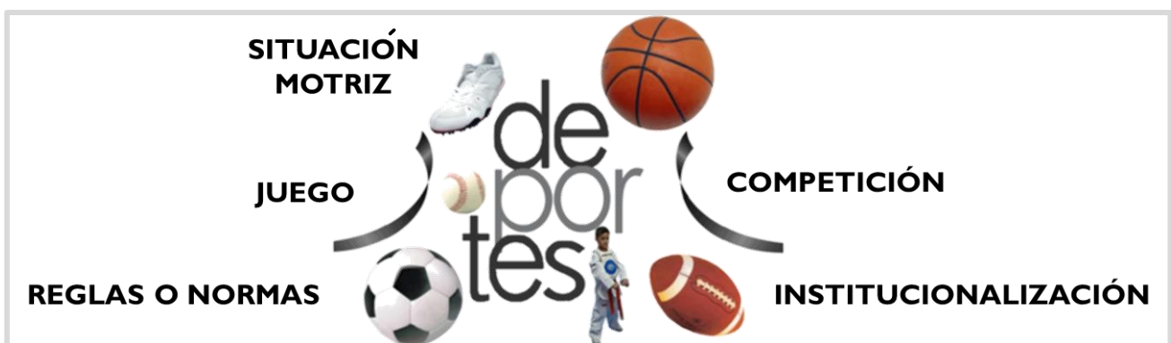
Figura 1: Características del deporte

Por su parte, Rossana (2020, https://bit.ly/3aKY6NL ) afirma que "el término deporte se refiere a una actividad física, básicamente de carácter competitivo y que mejora la condición física del individuo que lo practica".