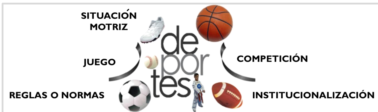
Figura 1: Características del deporte

Por su parte, Rossana (2020, https://bit.ly/3aKY6NL ) afirma que “el término deporte se refiere a una actividad física, básicamente de carácter competitivo y que mejora la condición física del individuo que lo practica”.