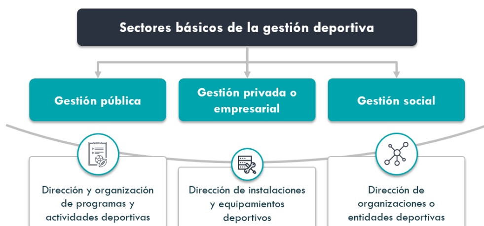
Figura 6: Sectores y ámbitos de la gestión