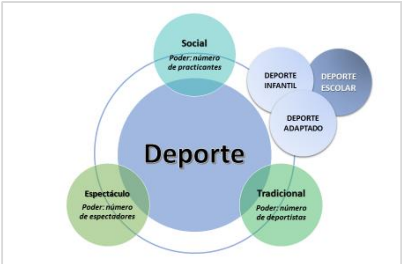
Figura 2: Mundo deporte