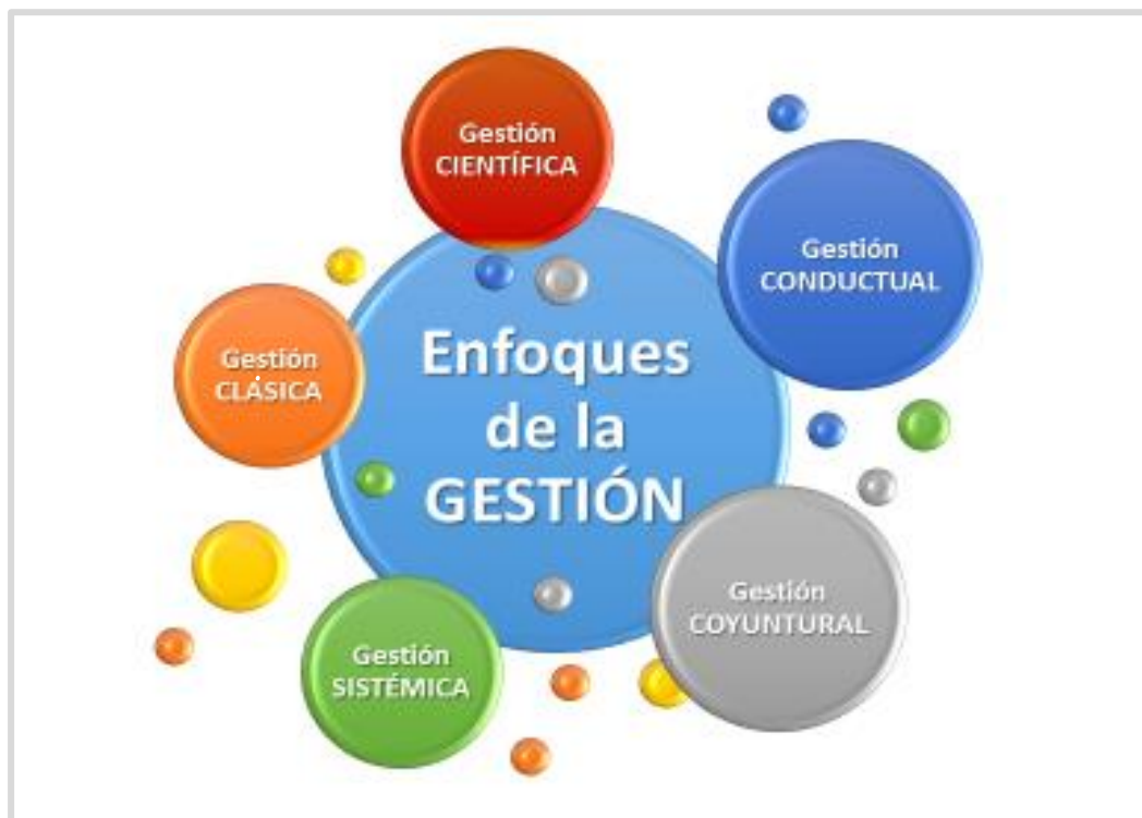
Figura 5: Enfoques de la gestión