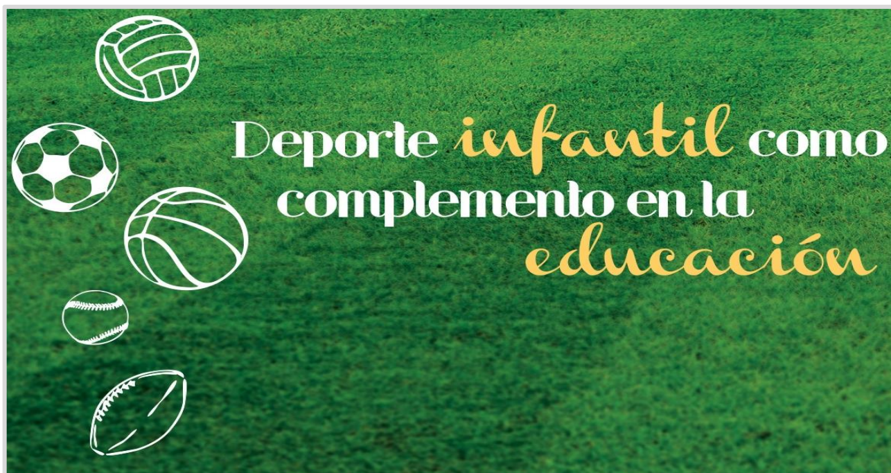
Figura 3: Deporte infantil

Más allá de lo antes citado, podríamos referenciar entre el deporte tradicional y el social, otros dos ámbitos que toman fuerza en nuestra sociedad, como lo es el deporte infantil y el deporte adaptado. El de iniciación o infantil, sienta sus bases en los grupos etarios bajos, donde muchas veces es tomado como medio o recurso educativo en la búsqueda de instalar conductas “saludables” en el desarrollo de la persona; y, por otro lado, formar deportistas que el día de mañana nutrirían los mundos antes citados. Y desde la concientización social de integración, inclusión y equidad, aparece con fuerza el deporte adaptado, pensado para aquellos sujetos que particularmente disponen de capacidades especiales, como destinatarios.