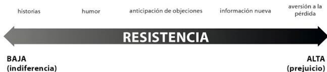
Figura 3: Niveles de Resistencia

Puede que a veces la falta de participación esté vinculada a la resistencia del público a ver, incorporar, aceptar y ser parte de la presentación. Respecto a este punto, Marañón (2012) señala que hay niveles de resistencia, dados por los pre conceptos que trae la audiencia.