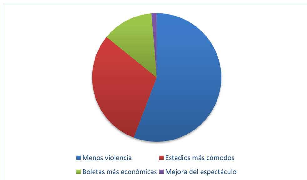
Figura 3: ¿Por qué motivos volvería al fútbol?