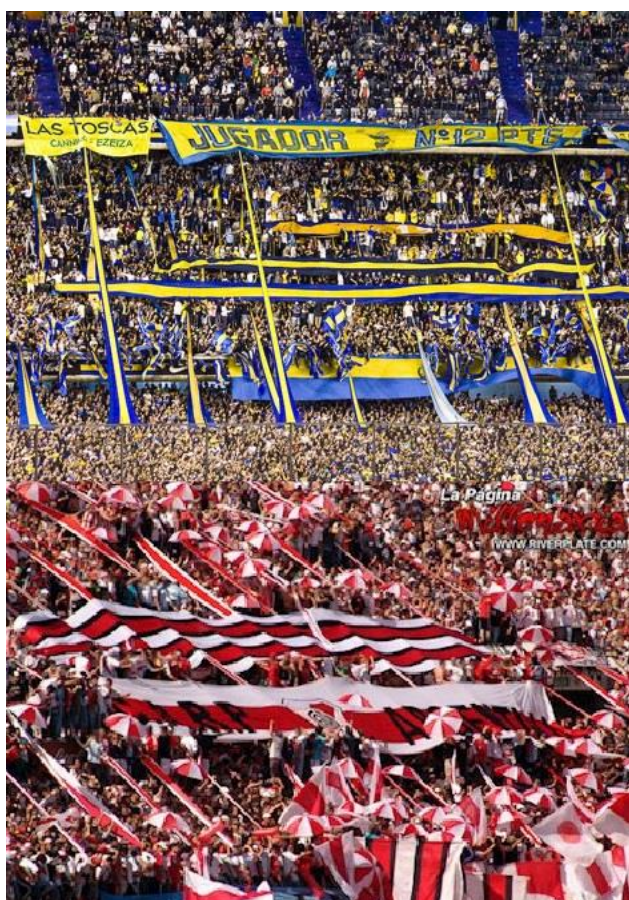
Figura 1: Barras bravas sudamericanas

La aparición del barrismo en Sudamérica data, aproximadamente, de los años 60; momento en el cual surgen grupos de personas que marcaron una diferencia en la forma de consumir productos y servicios futbolísticos en las tribunas. En sus inicios, los grupos de aficionados barristas no eran muy numerosos ni excesivamente violentos, pero con el pasar de los años, el número de integrantes fue creciendo y tomaron cada vez más poder en el estadio y, en algunas ocasiones, en el interior de las organizaciones deportivas del fútbol. Con el tiempo, este poder fue aumentando aún más, y no solo los barristas protagonizaron hechos de violencia, sino que también incursionaron en actividades, de alguna manera ilegales, con el objetivo de obtener un ingreso económico.