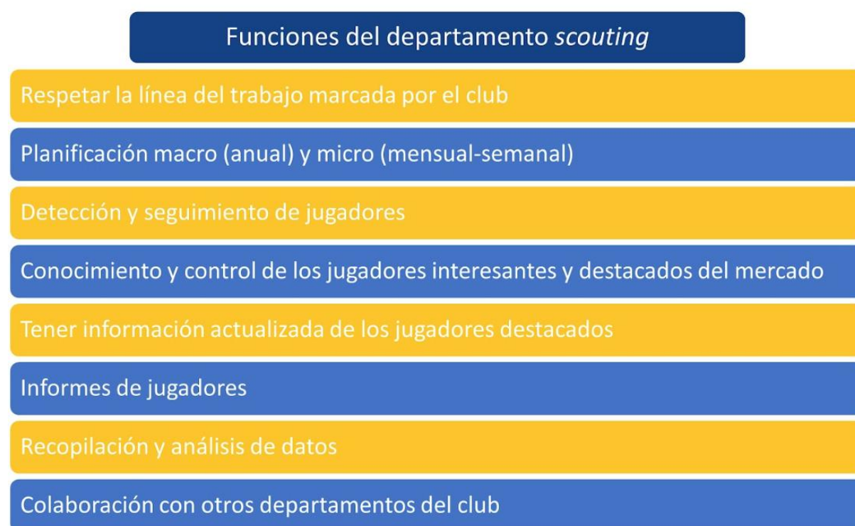
Figura 4. Funciones del departamento de Scouting

A continuación, se presenta una figura que resume las funciones principales del departamento de Scouting .