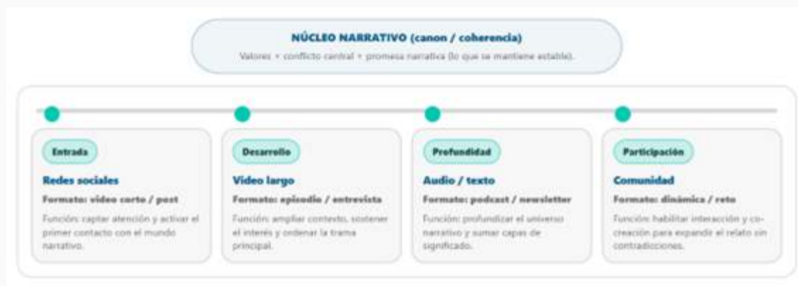
Figura 3. Esquema: arquitectura de expansión narrativa

Esta mirada arquitectónica permite pasar de una lógica reactiva —publicar contenidos según demanda inmediata— a una lógica estratégica, donde cada decisión responde a un diseño previo del sistema narrativo. Tal como señala Carlos Scolari, el valor del transmedia no reside en la multiplicación de piezas, sino en la orquestración de medios y formatos para producir experiencias narrativas coherentes y sostenibles (Scolari, 2013; 2019).