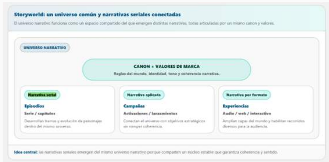
Figura 4. Storyworld: un universo común y narrativas seriales conectadas