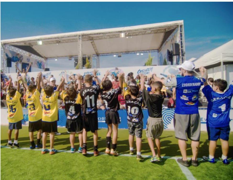
Figura 3: competição de futebol infantil

No início desta seção, ficou explícito que a CONMEBOL tem uma visão clara e ideias objetivas sobre o que implica trabalhar no âmbito do futebol de alto rendimento com jovens e adolescentes, de ambos os sexos, que são “menores de idade” e, portanto, sujeitos de direito, regidos pela Declaração dos Direitos da Criança (1959) e pela Convenção sobre os Direitos da Criança (1989) que os contempla até os 18 anos (CONMEBOL, 2019, p. 22).