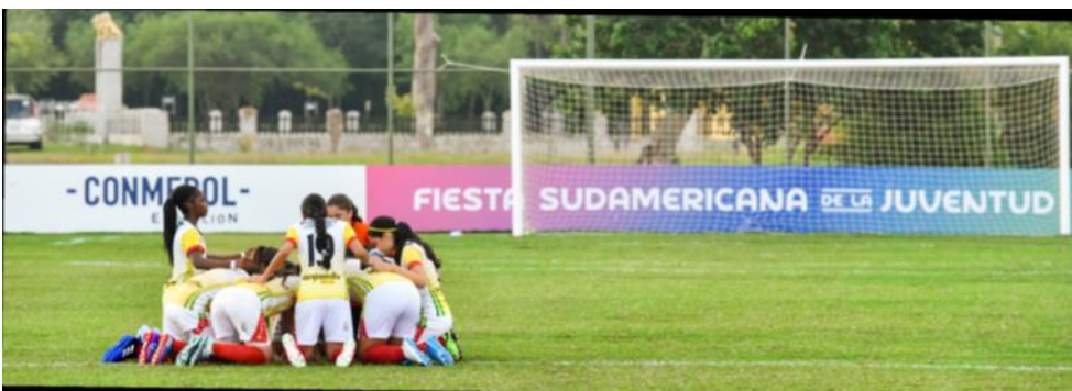
Figura 5: o futebol feminino como ponto de atenção da CONMEBOL

Considerando os desafios e exigências da sociedade sul-americana no século XXI, é dada uma ênfase especial aos treinadores, professores e instrutores que trabalham com futebol de base, levando em consideração que, um atleta de futebol 2.0, na América do Sul, deve tornar evidente seu valor como ser humano, em seu jogo e em seu vínculo com a sociedade, porque não é possível ignorar o fato de que, antes ou depois do jogo, o atleta pode ir a uma conferência de imprensa e neste momento possa estar exposto às opiniões da mídia em geral e das redes sociais, que "viralizam" suas opiniões sobre o futebol e outros assuntos sobre os quais ele ou ela externem sua percepção (CONMEBOL, 2019, p. 25).