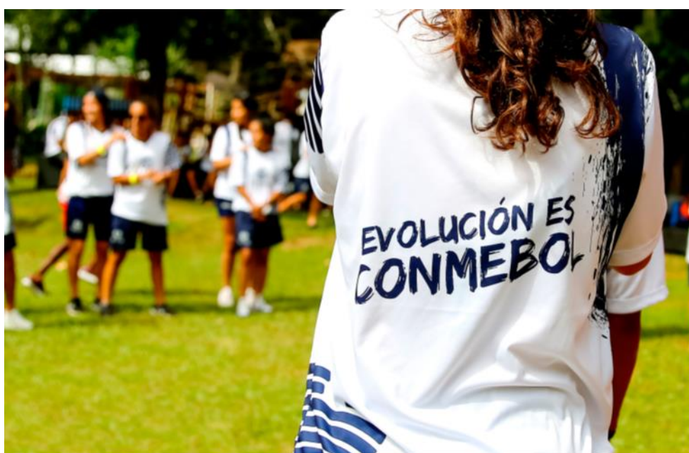
Figura 6: a evolução do futebol sul-americano tem um nome: CONMEBOL

assistente de vídeo), capacitações em todas as modalidades do futebol (futsal e futebol de areia), organização de mais campeonatos de base e investimento na qualificação da governança de clubes e federações. A união de todos estes elementos fomenta a qualidade do futebol sul-americano.