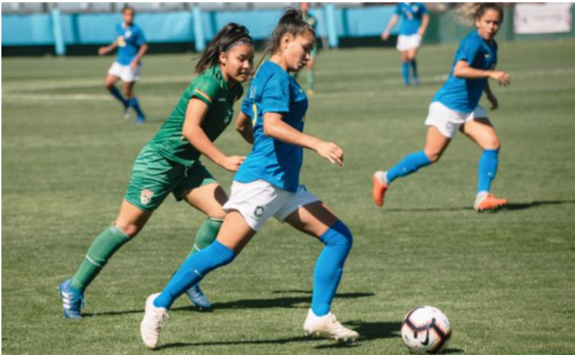
Figura 4: competição entre equipes femininas