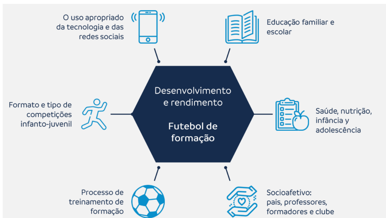
Quadro 1: Desenvolvimento e desempenho do futebol de formação