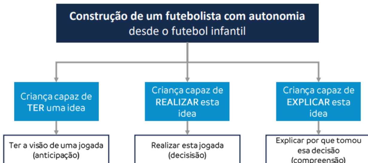
Figura 8: Construção de um jogador de futebol autônomo a partir do futebol infantil