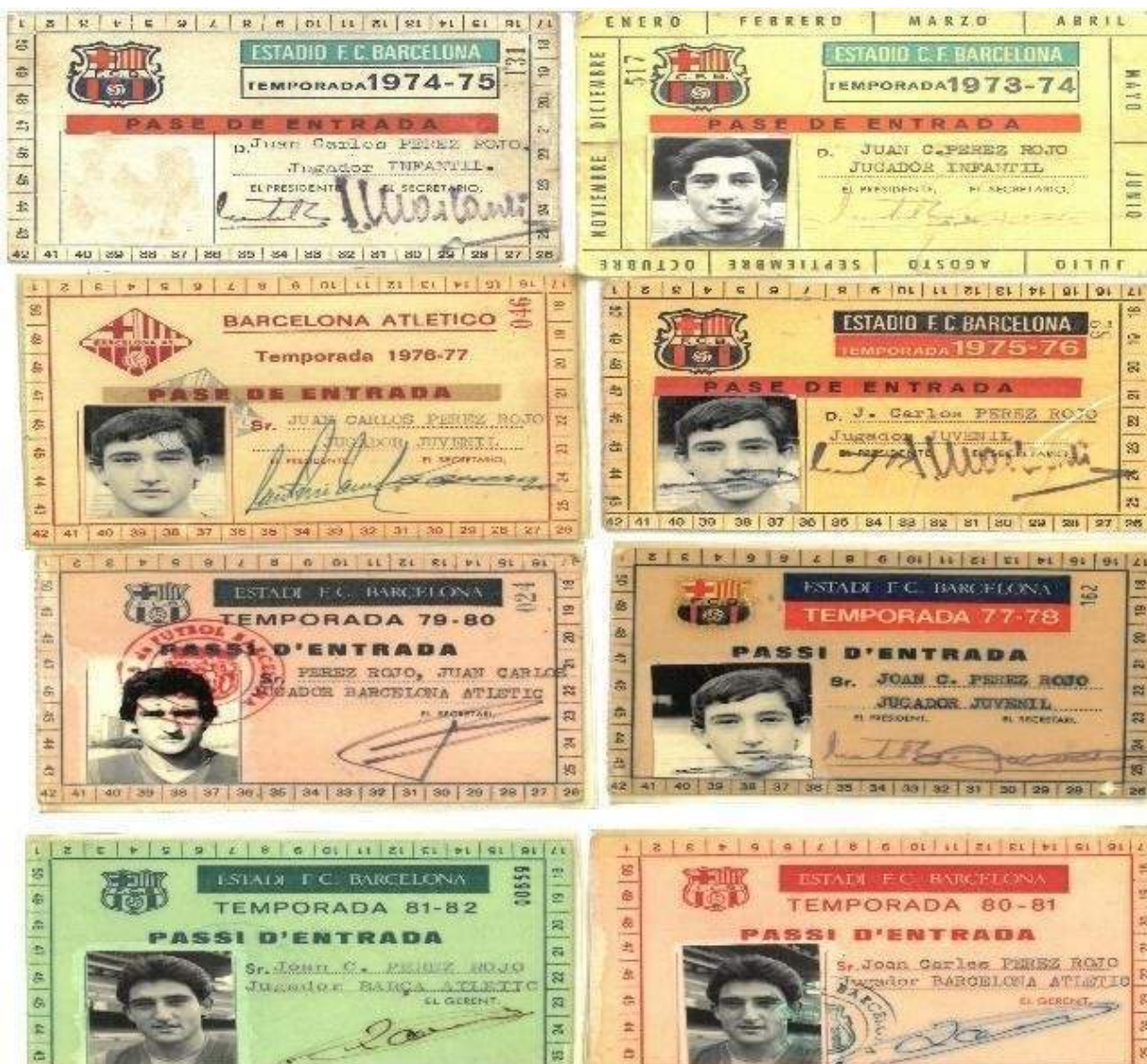
Figura 2: Temporadas en el FC Barcelona