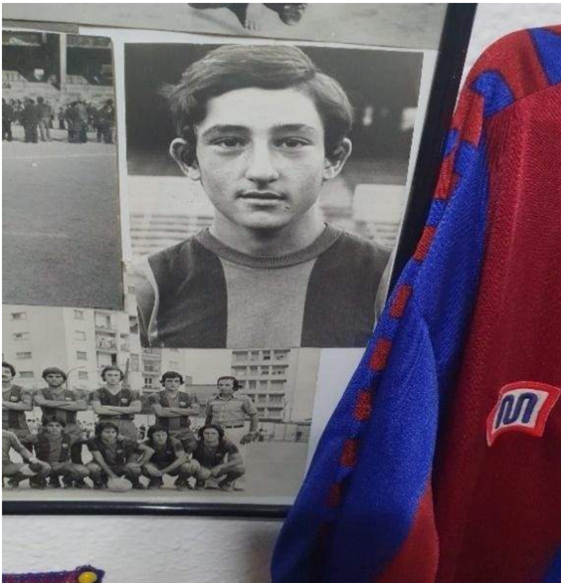
Figura 1: Inicios en el FC Barcelona

sorpresa muy grande; se lo debo todo al señor Tort, que también fue el que posteriormente me llamaría para ser entrenador.