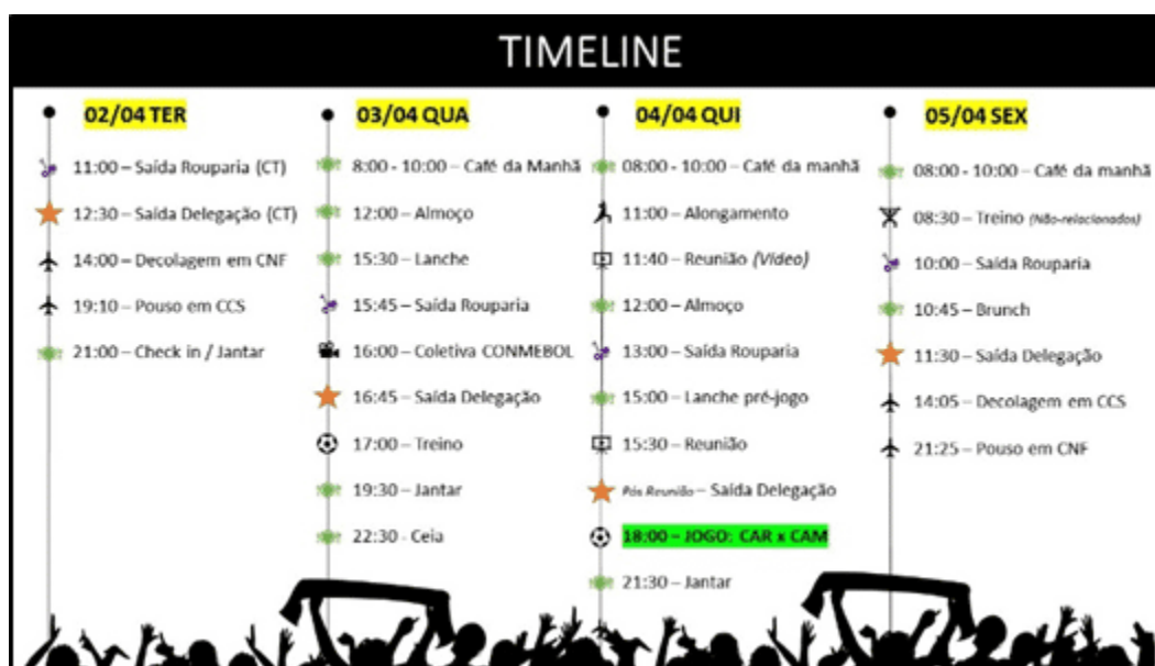
Figura 10. Modelo de timeline CAM

Fonte: [Imagem sin título sobre modelo de timeline CAM], (s.f.).