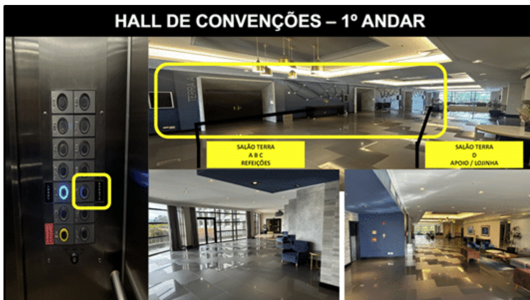
Figura 7: Sistema de comunicação e registros