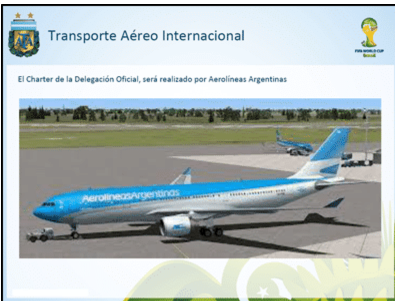
Figura 3: Transporte aéreo