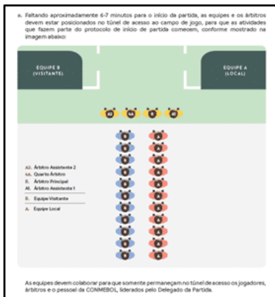
Figura 8. Exemplo de protocolo de premiação Copa Libertadores