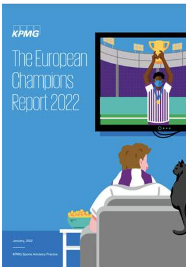
Figura 2. Reporte de los Campeones de Europa 2022 de KPMG