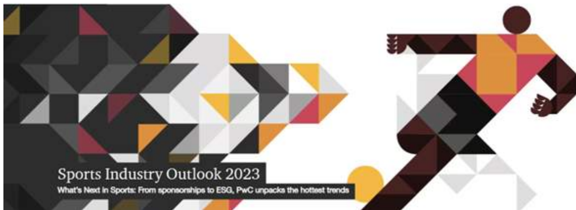
Figura 3. Informe Sport Industry Outlook 2023 de PwC