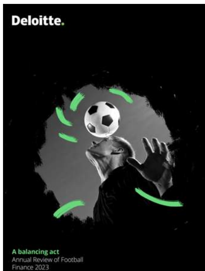
Figura 1. Informe Annual Review of Football Finance for 2023 de Deloitte