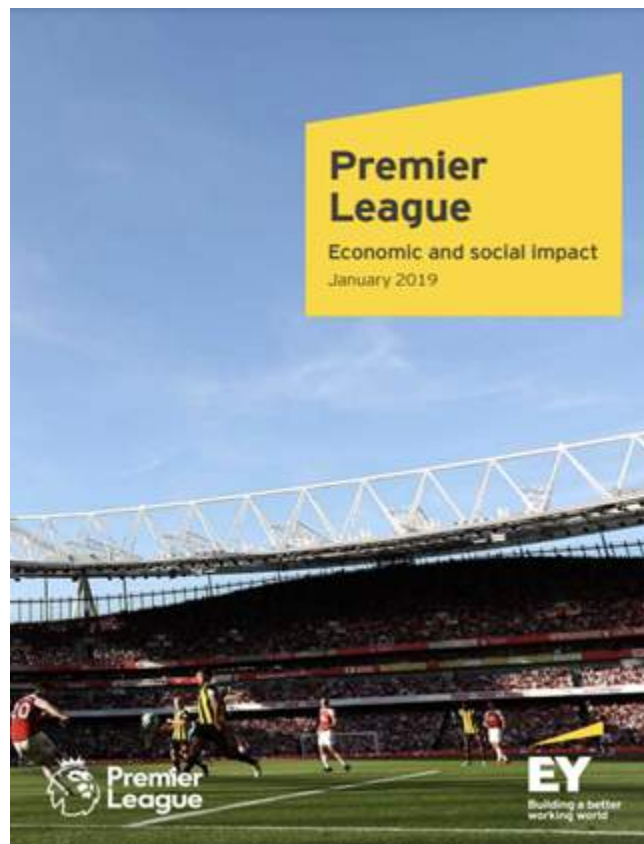
Figura 4. Informe Premier League's Economic and social impact report for 2019 de EY