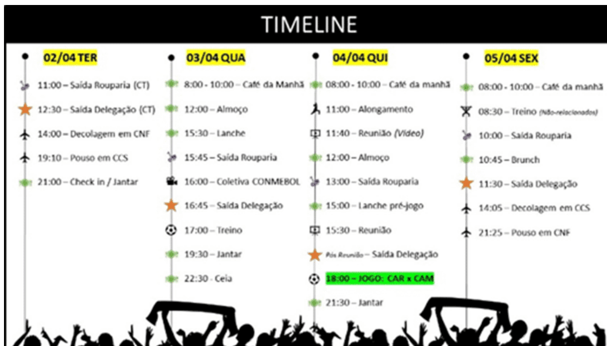
Figura 10: Modelo de Timeline CAM

Ref.: Apresentação Logística CAM – Copa Libertadores.2024: CAR x CAM - Timeline