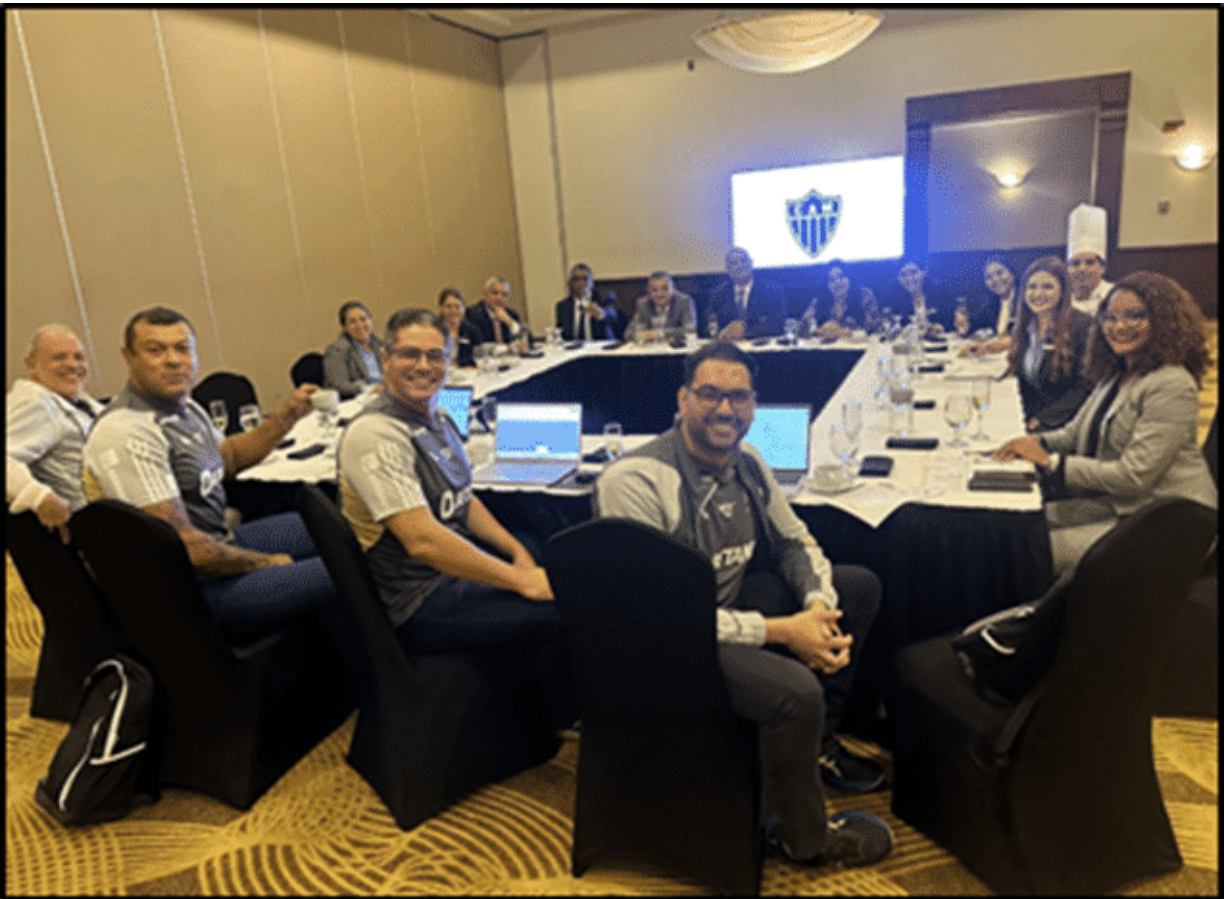
Ref.: Reunión de Coordinación Hotel – Copa Libertadores.24 – CAR x CAM