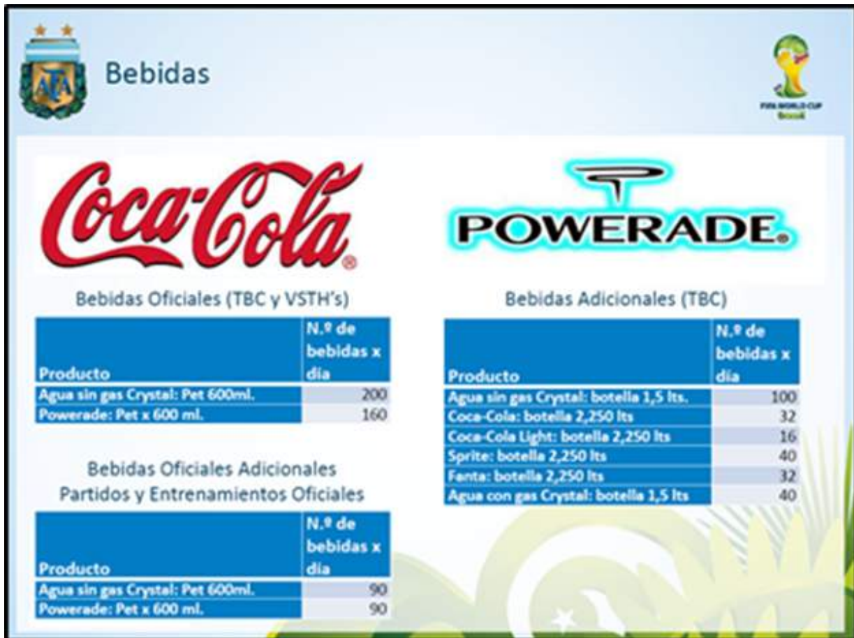
Figura 4: Capilaridad de atención

Ref.: Departamento de Selecciones Nacionales AFA – FIFA World Cup Brasil 2014