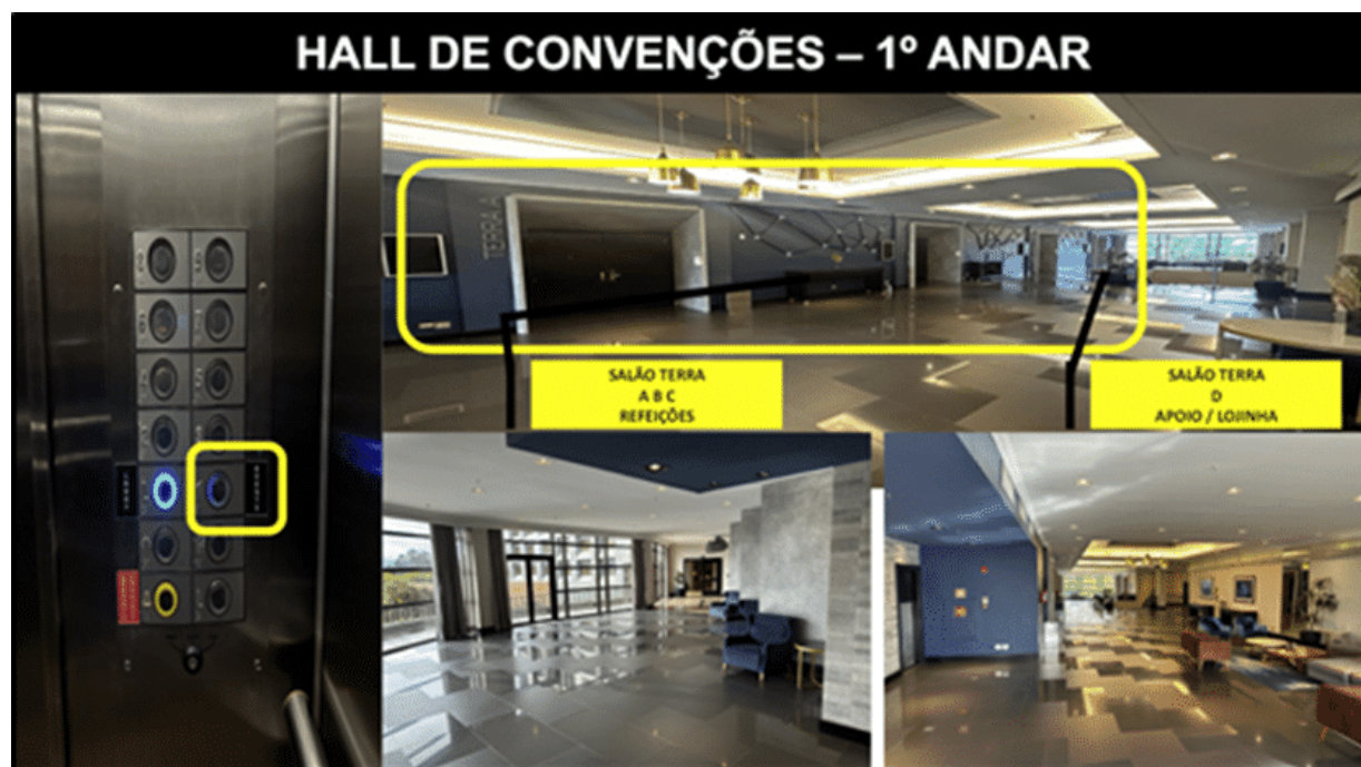
Figura 7: Sistema de comunicación y registros

Ref.: Minuta de Seguridad CAM – Brasileiro.24 – COR x CAM: Hotel Marriott Guarulhos