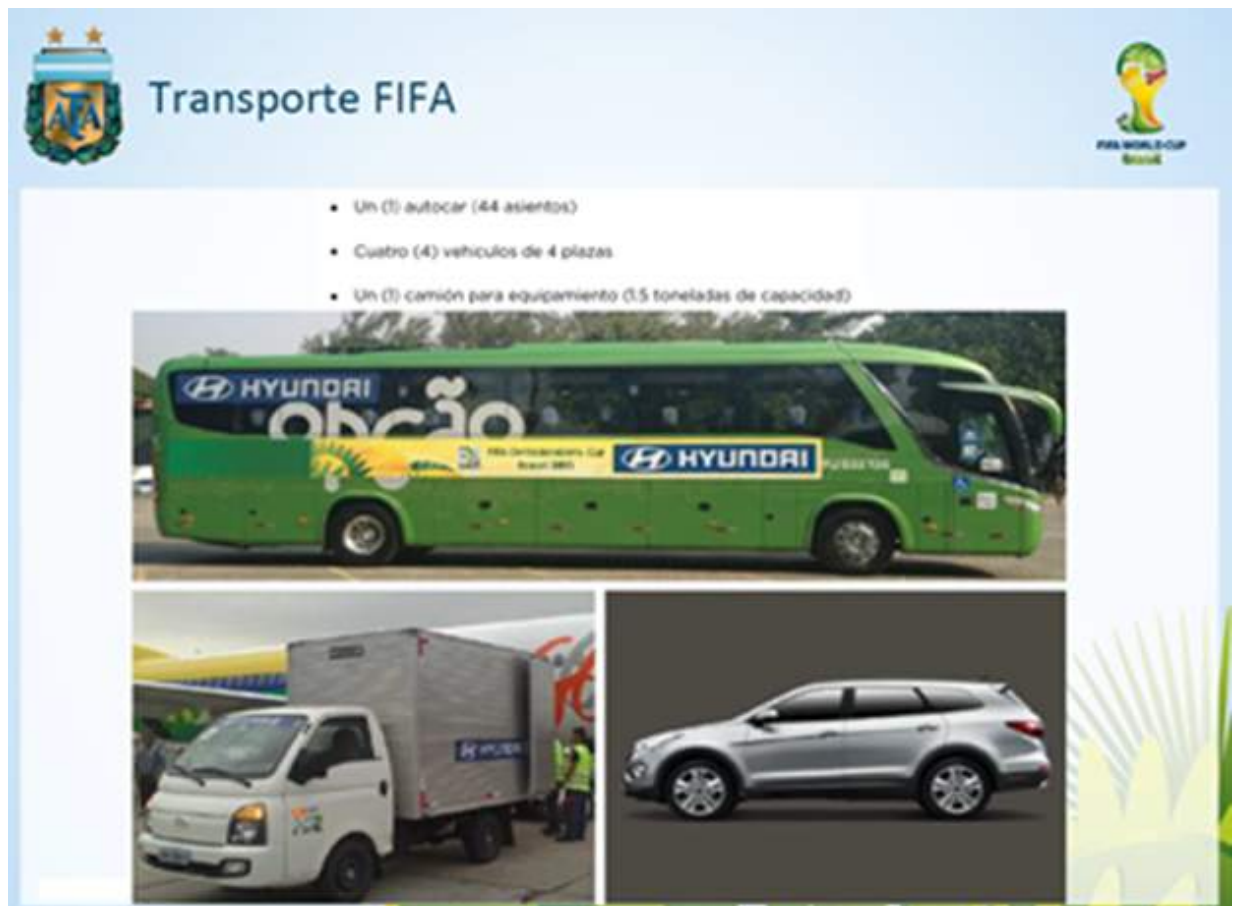
Figura 2: Transporte terrestre