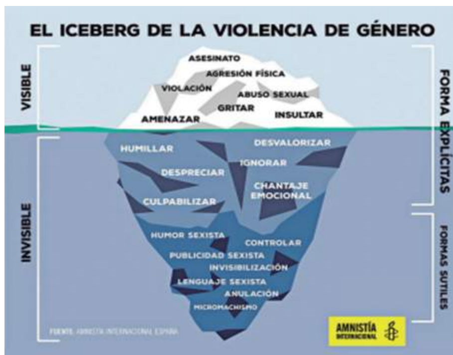
Figura 1: El iceberg de la violencia de género

Este análisis pone de relieve la necesidad imperante de abordar y erradicar la violencia de género en todas sus formas, reconociendo la interseccionalidad de las opresiones y trabajando hacia una sociedad que promueva la igualdad, la dignidad y el respeto de todos los individuos, sin importar su género, orientación sexual o identidad de género. La reflexión sobre estas dinámicas es esencial para avanzar hacia entornos deportivos y sociales más inclusivos y seguros para todos.