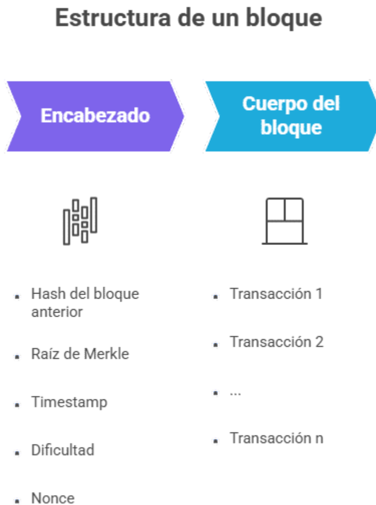
Figura 1. Estructura de un bloque

inmutabilidad y la trazabilidad que caracterizan a los sistemas blockchain .